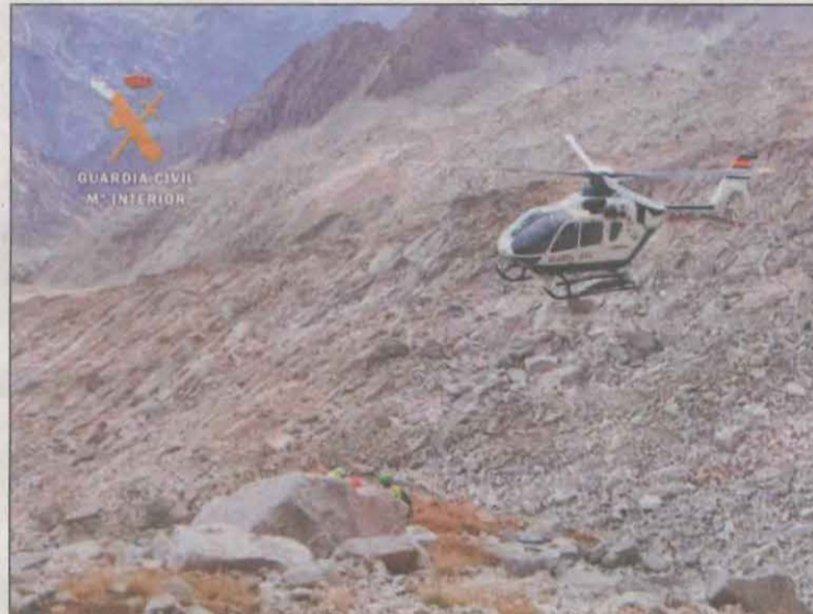
Un helicòpter de la Guàrdia Civil al lloc dels fets

L'accident va tenir lloc a les 13.38 hores quan, segons els Bombers van ser alertats de la caiguda per un barranc d'una dona que feia alpinisme per la punta oriental del pic de Russell, al terme municipal de Montanuy (Osca). Un helicòpter dels Bombers va anar al lloc dels fets per participar en les tasques de salvament, tot i que a l'arribar al lloc l'excursionista, veïna de València, ja havia mort després de caure d'una considerable