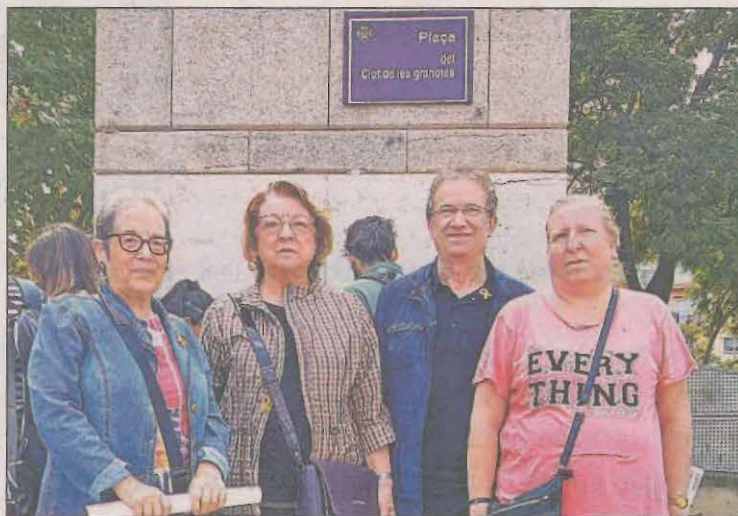
Alguns dels veïns que reclamen el canvi de nom

Veïns independentistes, com cada any en aquestes dates, van enganxar un cartell per simbolitzar el canvi de nom de la plaça que, oficialment es diu de la Constitució, per la nomenclatura amb la qual es coneix per la ciutadania, com es Plaça del Clot de les Granotes. Demanen a la Paeria que canviï el nom oficialment.