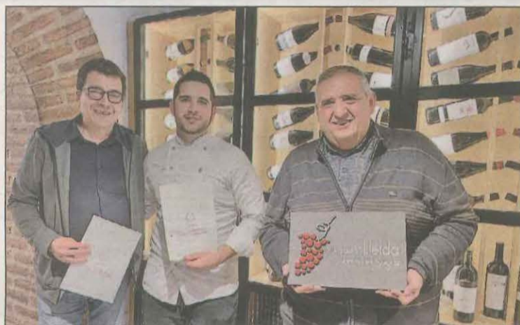
Presentació de la carta de vins

Les subzones de Raimat i Urgell són presents amb vins de Raimat i Castell del Remei, Lagravera d'Alfarràs i el Celler Sanuy. Tam-