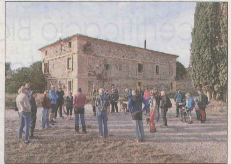
Els excursionistes al voltant de Cal Macià

Una cinquantena de persones van participar ahir en la caminada popular per l'entorn de Cal Macià-Casa Vallmanya, que va ser guiada pel geògraf de la Universitat de Lleida (UdL), Ignasi Aldomà.