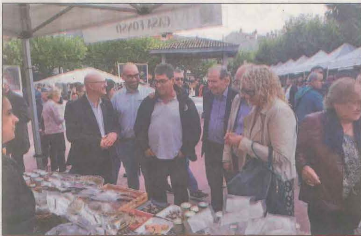
La fira acull parades de productes agroalimentaris