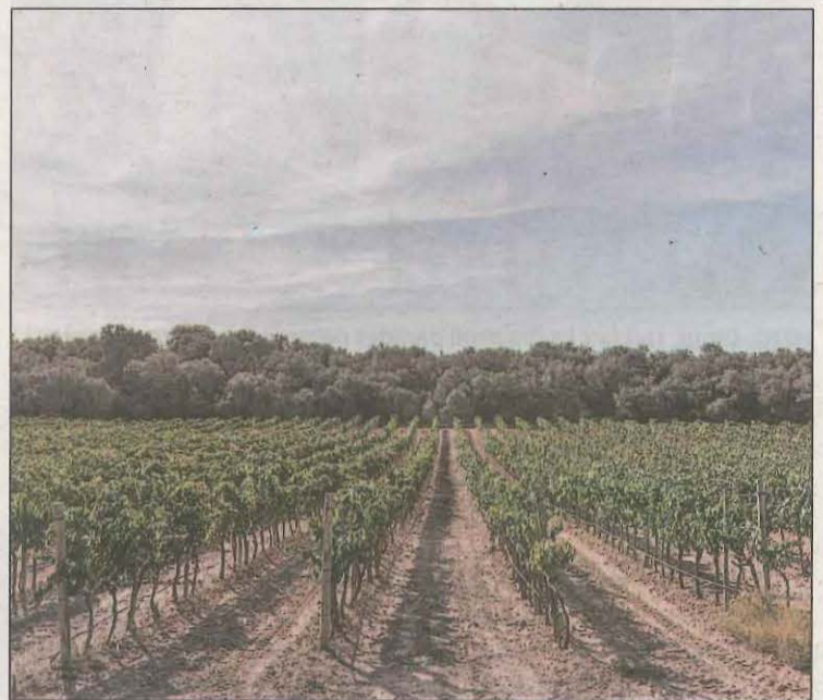
Un dels paisatges de vinya a Lleida

730. De la subzona Garrigues hi ha Matallonga, Torres, Clos Pons, Tomàs Cusiné, Cérvols, Mas Blanch i Jové, i Vinya els Vilars. D'altra banda, de la subzona Artesa de Segre s'hi troben Costers del Sió, Vall de Baldomar, Mas Ramoneda i Celler Montsec.