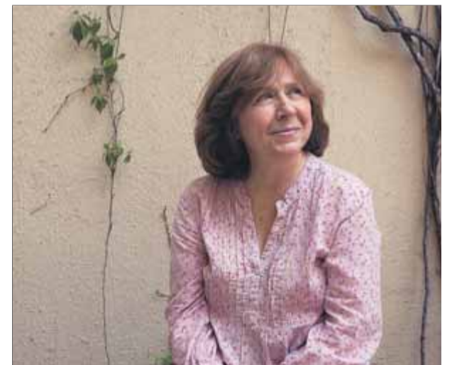
Svetlana Aleksiévix , premi Nobel de Literatura el 2015 i Premi Internacional Catalunya el 2022

Enfrontada al govern i a la censura bielorusses, Aleksiévix va abandonar Bielorússia l'any 2000. El 2011 va tornar a Minsk. El 2015 va ser distingida amb el premi Nobel de Literatura, la primera escriptora de no-ficció que rep aquest premi en més de mig segle. ■