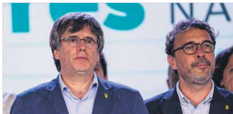
Carles Puigdemont i Josep Rius, en un acte de Junts per Catalunya