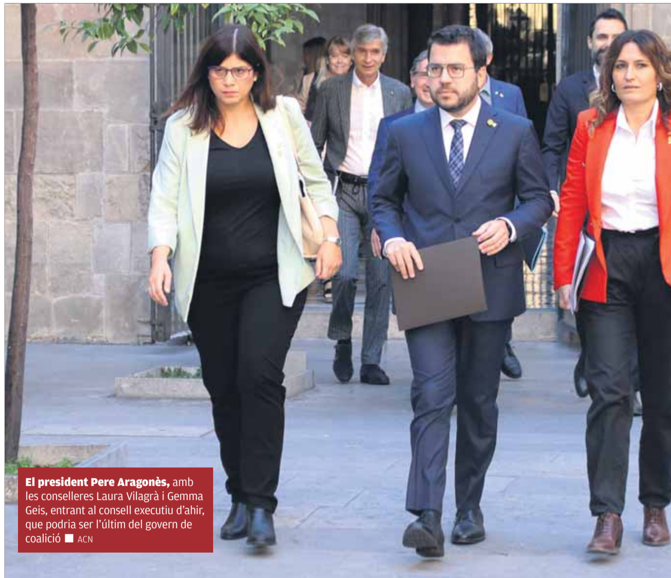
El president Pere Aragonès, amb les conselleres Laura Vilagrà i Gemma Geis, entrant al consell executiu d'ahir, que podria ser l'últim del govern de coalició