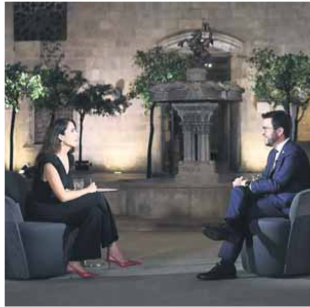
El president de la Generalitat, en un moment de l'entrevista d'ahir en directe que va oferir a TV3 i Catalunya Ràdio

Ja en clau de l'actualitat més immediata, una de les primeres qüestions que va haver de respondre Aragonès és com s'ho farà amb només 33 escons al Parlament. La recepta que va donar serà la de buscar acords, una estratègia que passarà un primer test de força amb l'aprovació del pressupost. Sobre això va reiterar que la seva priori-