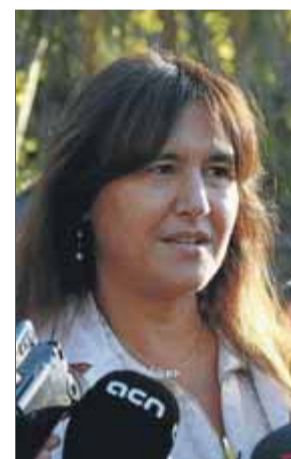
Laura Borràs en una imatge recent

Deu dies més de marge. El Tribunal Superior de Justícia de Catalunya (TSJC) va acceptar ahir donar més temps a la defensa de la presidenta suspesa del Parlament, Laura Borràs. En concret, els advocats havien al·legat al TSJC que prorrogués el termini per lliurar el seu escrit de classificació definitiu, en espera que els perits elaborin un informe sobre la documentació informàtica intervinguda en el cas, al·legant que no havien tingut accés íntegre a aquesta part del sumari, amb l'objectiu de proposar una prova pericial informàtica. Laura Borràs és acusada per suposadament haver fraccionat contractes