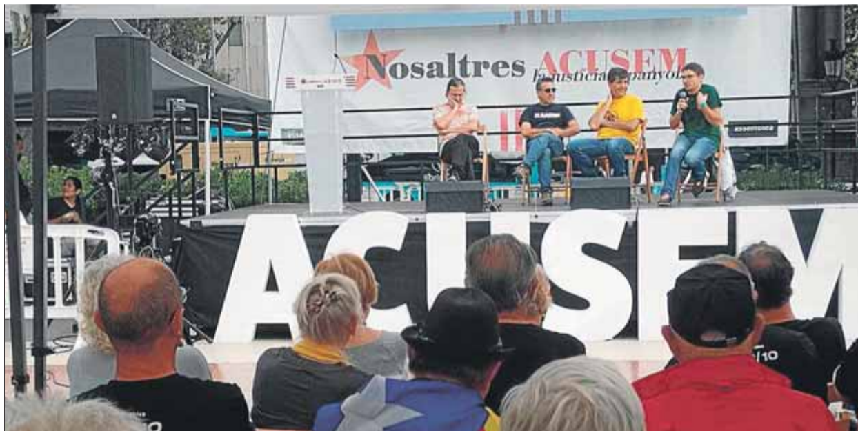
Quatre representants dels represaliats per l'Estat intervenint ahir a l'escenari de l'acampada de l'ANC ■ JPF

Un dels que van prendre la paraula va ser To-