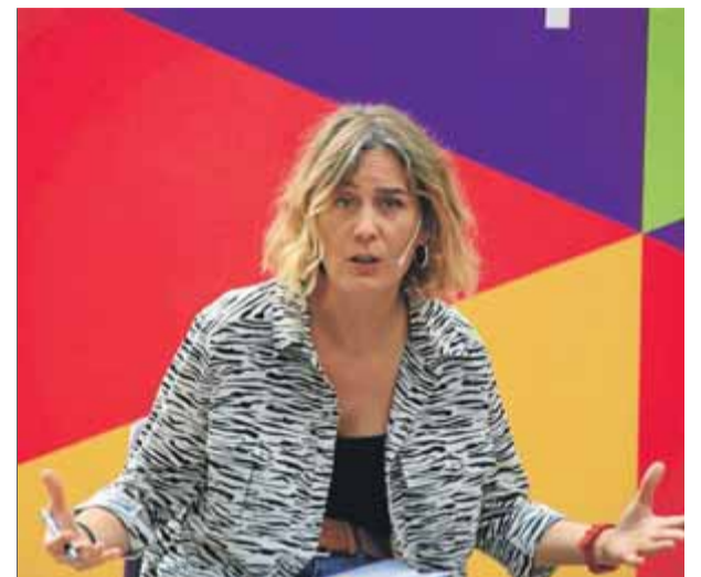
La presidenta d'En Comú Podem, ahir, a l'acte de presentació de l'alcalde de Castelldefels, Candela López

d'esquerres”, tot i ser anticatalanista. L'anticatalanisme dels taronja, però, es manifesta “amb tics populistes” que “van contaminar la resta de partits”, com apunta el catedràtic de ciència política Jordi Matas. La semblança es troba en l'espanyolisme que comparteixen, la “demagògia”, però també en l'èxit fulgurant i la consegüent davallada. Aterrant en l'actualitat, després del “suflé” del partit, Matas augura que intentar fer una “societat dicotòmica”, aprofitant l'origen de les persones, “no té cap recorregut polític perquè aquí estem tots barrejats”. L'èxit de Ciutadans es va produir en un context de polarització, en què va funcionar el seu discurs basat en “atacar tot allò que fes olor de catalanisme”, però afegeix que no tenia un component social, sinó fonamentalment identitari. Per això, assevera que políticament parlant poc té a veure amb el lerrouxisme, que és un mite que encara perdura. ■