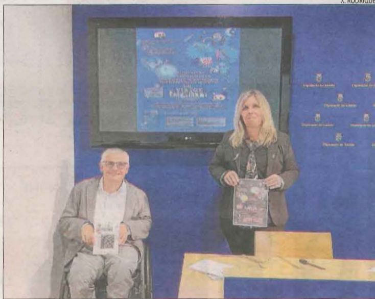
Latorre i Erta ahir durant la presentació de les rutes virtuals.

Els protagonistes són les Bruixes dels Carantos, les Encantàries i l'última habitant de Suert