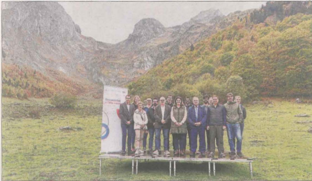
Tots els responsables de la connexió via satèl·lit del refugi amb la seu dels Bompiers.

El refugi de l'Artiga de Lin fa la primera trucada als Bompiers || Tecnologia per pal·liar la falta de cobertura mòbil