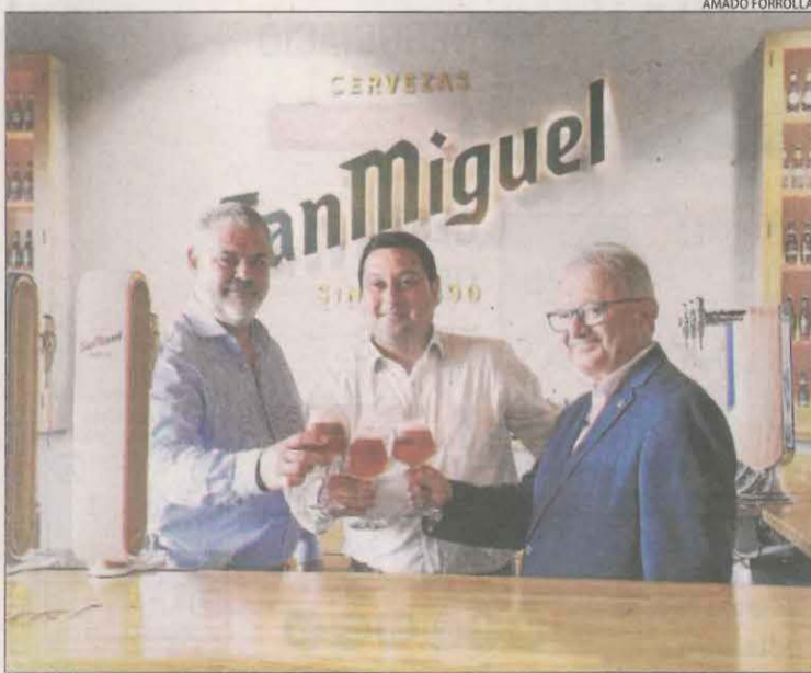
El grup Mahou-San Miguel, Fecoll i Paeria van presentar Cervisia.