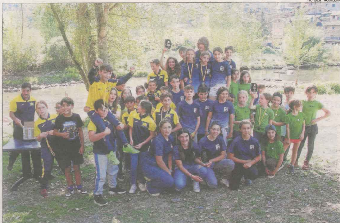
A la imatge, el podi per equips, amb el Mig Segre com a campió absolut.