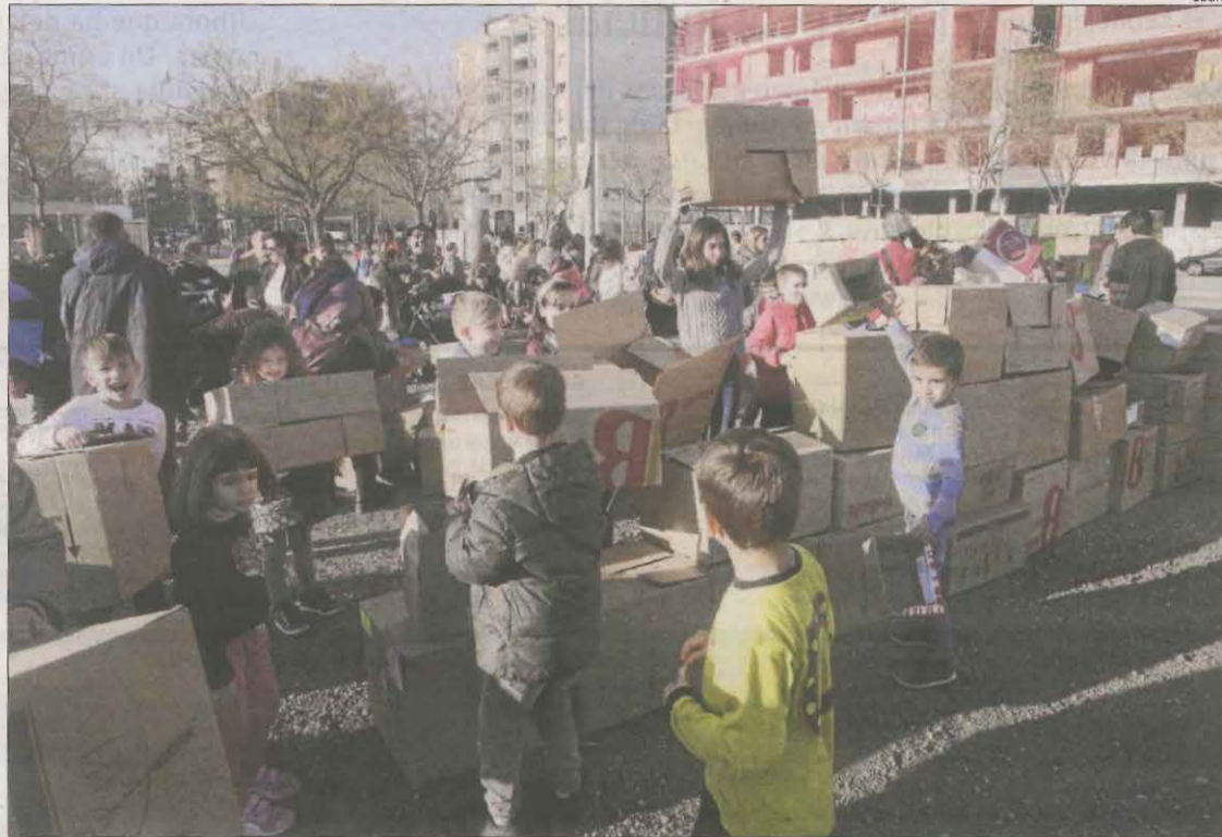
El 2019, alumnes i pares van 'construir' l'institut amb caps de cartró a tall de reivindicació.

L'alcalde, Miquel Pueyo, va afirmar que "per a Lleida és summament important" l'institut de Cappont i va remarcar