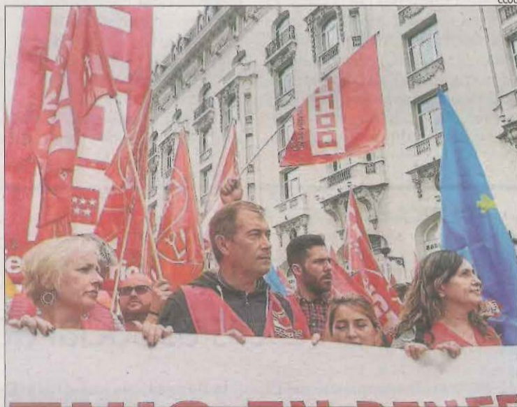
La protesta d'ahir dels treballadors de Renfe.

D'altra banda, uns 1.500 treballadors de Renfe, segons els sindicats, es van concentrar ahir dimecres davant el Con-