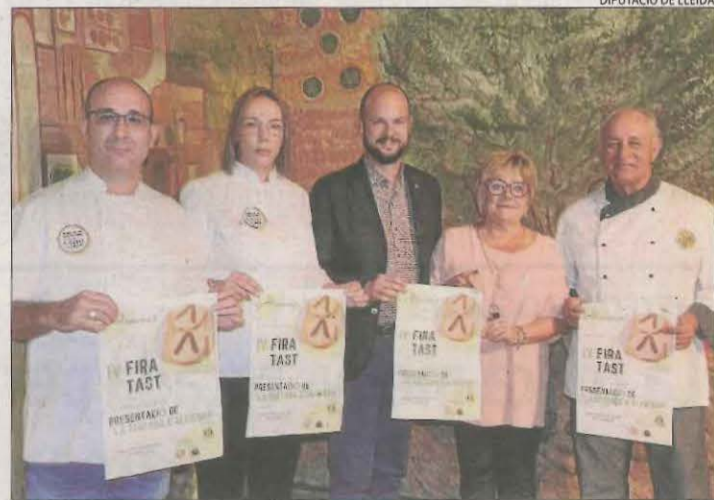
Presentació aquesta setmana de Fira Tast d'Almenar.