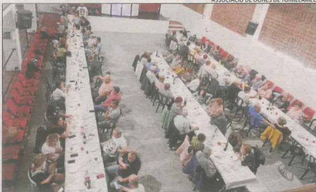
ASSOCIACIÓ DE DONES DE TORRELA MEU