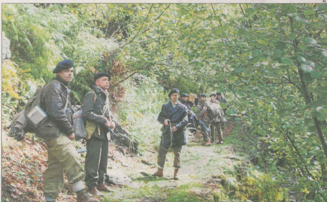
Participantes en la recreación de la invasión de la Val d'Aran en el recorrido hasta Bagergue.

NAUT ARAN | Una decena de miembros de las asociaciones de recreación histórica Sancho de Beurko y Primera Línea han recreado la invasión de la Val d'Aran por parte de las guerrillas antifranquistas 78 años después con el objetivo de recuperar la memoria de este episodio. Así, esta iniciativa se basa en los hechos ocurridos el 19 de octubre de 1944 cuando, con la segunda guerra mundial en su recta final, miles de guerrilleros antifranquistas cruzaban los Pirineos por diversos puntos con el objetivo de ocupar la Val d'Aran. La recreación se