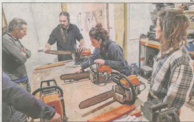
Grupo de asistentes a un curso de motosierra.