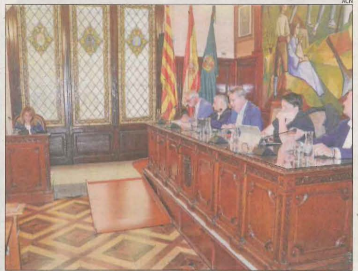
El pleno de la Diputación durante la sesión celebrada ayer.

Por lo que respecta a las mociones, la corporación dio luz verde a una de En Comú Podem para exigir al Estado y la Generalitat mejoras en las carreteras y desplegar rutas