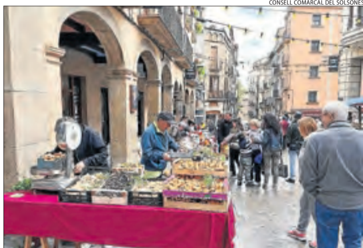
CONSELL COMARCAL DEL SOLSONÈS