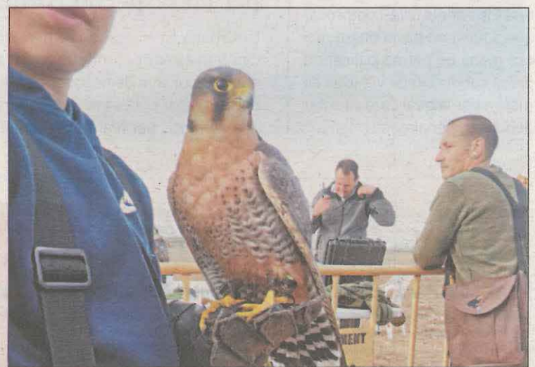
Una de les aus participants en el campionat

Els assistents van poder contemplar les habilitats de més de 70 aus que van participar en aquest esdeveniment de referència a Catalunya, que provoca molta expectació i curiositat per part del públic.