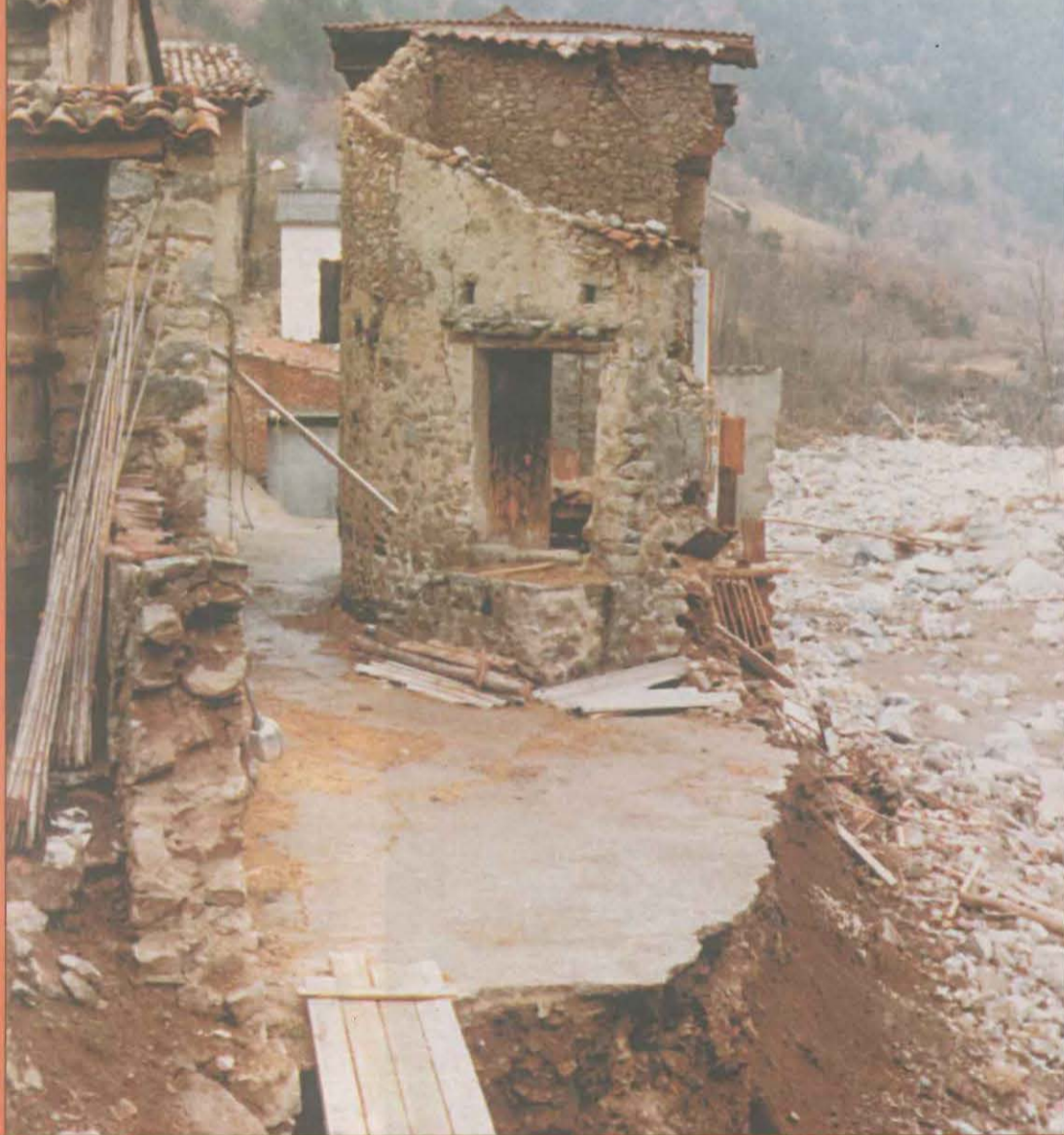
Estado en el que quedó Pont de Bar tras la riada