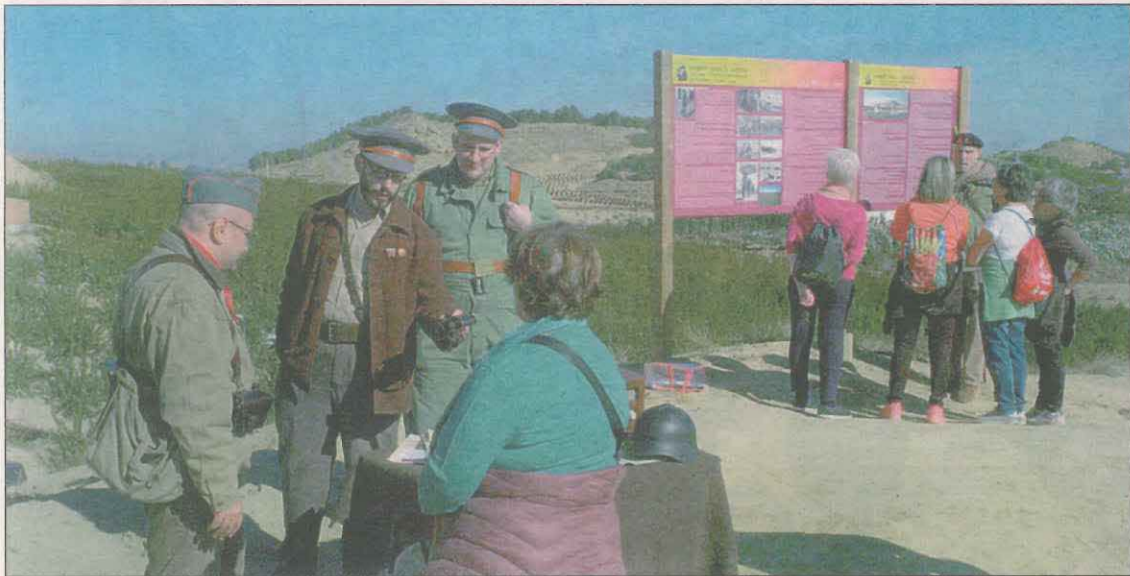
Recreació històrica dels soldats durant la caminada per l'itinerari de Robert Capa