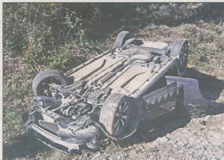
El turisme bolcat a la C-14, a Bassella

ral. Fins al lloc s'hi van desplaçar els Bombers i el SEM, allà van comprovar que dues persones van resultar ferides lleus i les van evacuar a l'Arnau de Vilanova. D'altra banda, un turisme va bolcar ahir a tres quarts d'una de la tarda a la carretera C-14 en el seu pas pel terme de Bassella. Com a conseqüència, quatre persones van resultar resultat ferides lleus.