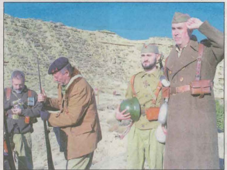
Participantes en la actividad en la Serrabrisa