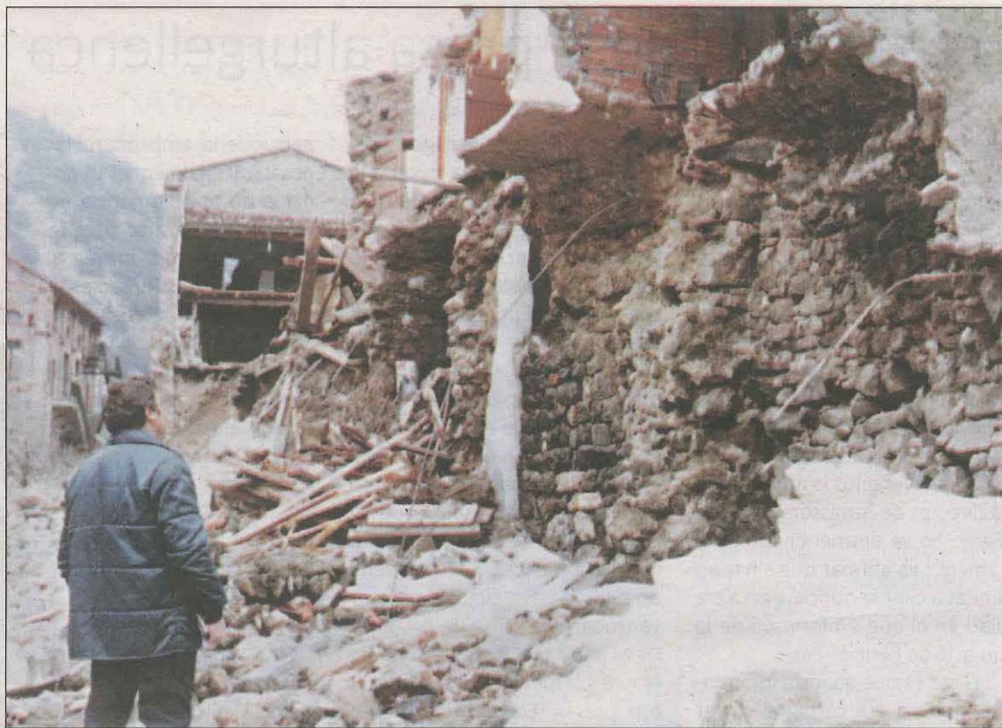
FOTO: A. Casanovas (Fons Cal Roig / AHCAU) / Un veí observa atònit una casa destrossada pels aiguats

Per una altra banda, el 26 de novembre tindrà lloc la segona activitat per recordar els fets, Les causes de la desaparició de Pont de Bar , una visita guiada a càrrec del geòleg Albert de Gràcia, el qual explica a LA MAÑANA que l'objectiu de l'activitat és "parlar sobre la meteorologia i els fets que va provocar el clima extrem d'aquell dia" i afegeix que s'abordarà, entre altres aspectes, "els registres, les alçades dels rius que hi va haver i l'esllavissada al vessant de la muntanya que va fer desaparèixer el poble".