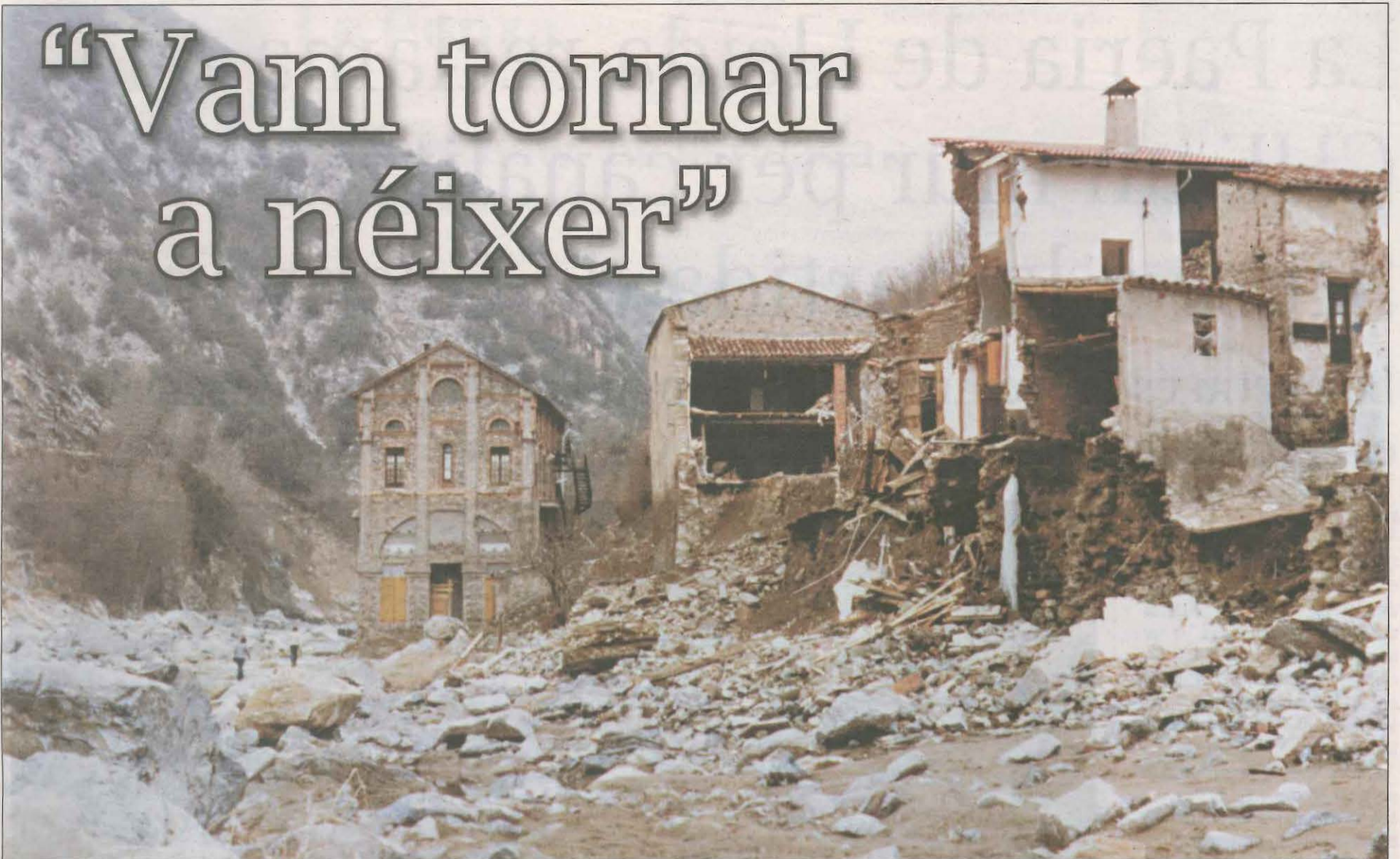
Imatge de la runa i els danys que van provocar els aiguats del 1982 a Pont de Bar, uns fets dels que fa 40 anys