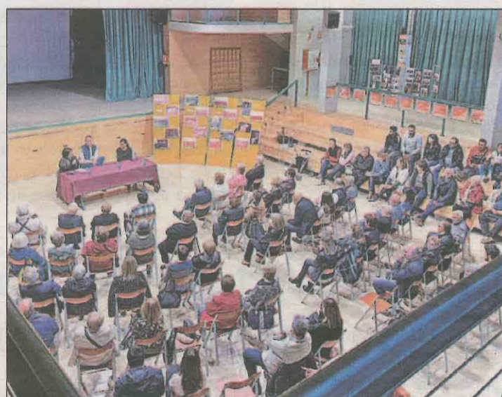
La mostra va ser inaugurada ahir diumenge

Amb aquestes magnituds de cabal es van inundar parcialment diversos municipis, entre els quals hi ha capitals de comarca com la Seu d'Urgell, Sort, Balaguer o la mateixa ciutat de Lleida. També la capital andorrana. Fins i tot, l'allau d'aigua sobtada va provocar el que s'anomena terràtremol induït, de caràcter lleu, al pantà d'Oliana.