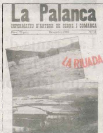
Portada de la revista 'La Palanca' sobre la riuada del 82

La notícia de la crescuda del riu (a causa d'una gota freda