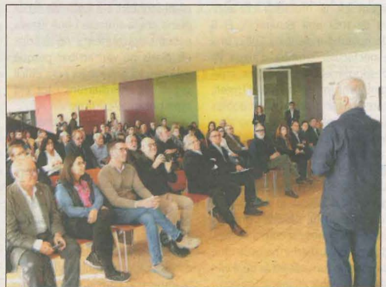
Un moment de l'acte en record de la riuada ahir

ció commemorativa amb imatges dels fets que es pot visitar a la als baixos del Palau de la Paeria fins al 27 de novembre, que, com moltes altres zones properes al riu, van quedar totalment inundats aquells dies. L'exposició compta amb un documental que recull el testimoni de persones de diferents àmbits que ho van viure en primera persona, com ara veïns, personal de salvament i personal municipal. La mostra recull imatges antigues conservades a l'Arxiu Municipal i a l'Arxiu Fotogràfic de l'Institut d'Estudis Ilerdencs. S'han previst uns itineraris per la ciutat els dissabtes per explicar la Riuada.