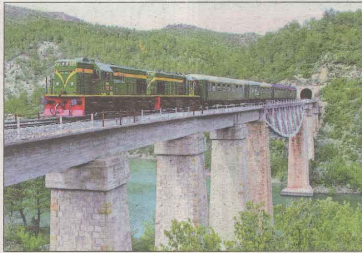
Imatge del Tren dels Llacs durant un dels seus trajectes

total de 5.831 persones usuàries, fet que suposa un increment del 24% respecte la temporada passada. Concretament, el Tren Panoràmic, ha transportat 369 passatgers, amb un augment del 4%. Pel que fa al Tren Històric, 5.462 viatgers han gaudit del servei durant la temporada 2022, un 25% més que l'any 2021.