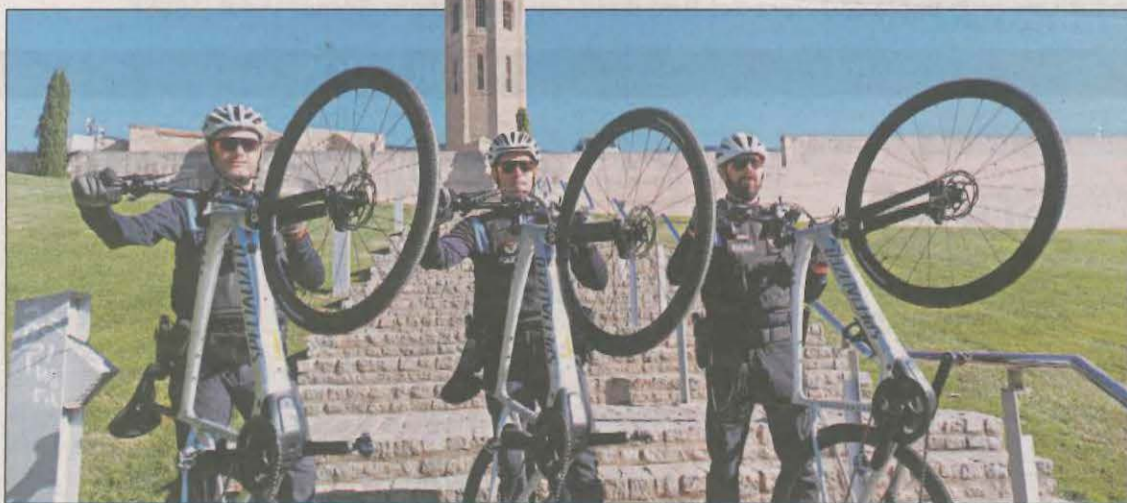
Tres miembros de la Guàrdia Urbana muestran sus flamantes bicicletas eléctricas

Se trata de bicicletas de montaña que sustituirán a las convencionales y que facilitarán el trabajo a los agentes de la unidad ciclista del cuerpo, que realizan una media de 20 a 30 kilómetros diarios. El coste es de más de 25.000 euros. LOCAL | PÁG. 10