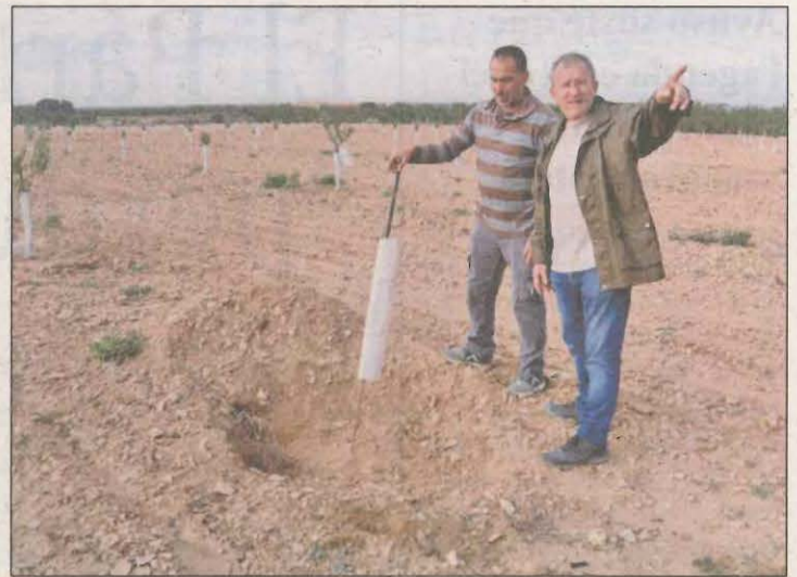
Pagesos comprovant els desperfectes fets pels conills

200 animals han passat l'estiu a la muntanya aprofitant les pastures i ara, abans no comenci a nevar, es desplacen a cotes més baixes per passar bona part de la tardor i l'hivern. Aquest és un episodi que es repeteix anualment.