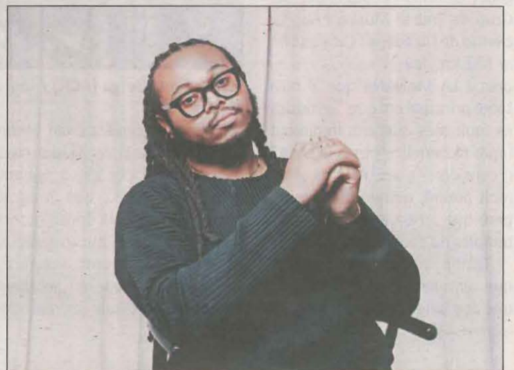
El concert serà al cafè del Teatre (22.30 hores)

D'altra banda, la biblioteca de l'IEI va acollir ahir l'inici del quart del Seminari de Lectura i Transcripció de Documents, que es completarà els dies 17 i 24.