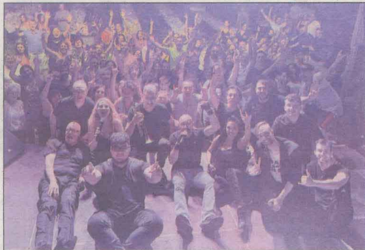
L'Orquestra Saturno hi actuarà demà dissabte