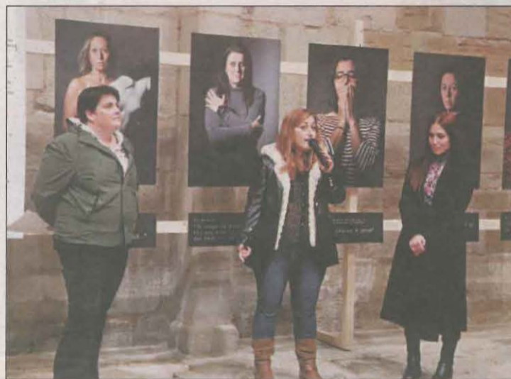
Dotze retrats de la fotògrafa formen l'exposició 'Crits'

llista d'aquest prestigiós guardó que l'any passat es va atorgar a la poeta Cristina Peri Rossi, i que en les seves anteriors edicions van ser premiats Francisco Brines i el poeta lleidatà Joan Margarit, que va morir el passat 2021.