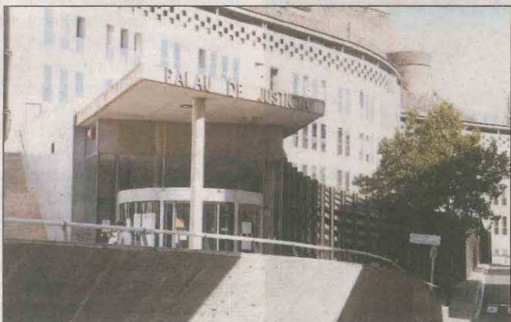
El judici se celebrarà dijous a l'Audiència de Lleida

Segons relata el ministeri públic en el seu escrit d'acusació, El primer abús sexual va passar entre els mesos d'abril i maig, quan l'home es va acostar a una nena dins d'un centre religiós on hi havia més gent i li va tocar els pits. Així mateix, el segon cas va pas-