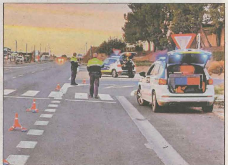
Control policial a la carretera de Vallmanya

S'ha de dir que el ministeri fiscal demana per a cadascun d'ells una pena de 3 anys de presó i que indemnizzi cada nena amb 1.500 euros per danys morals.