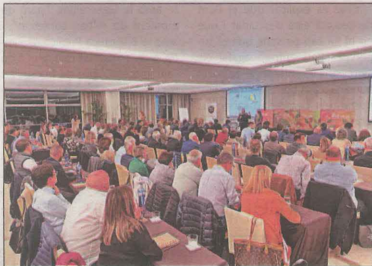
Un dels moments de l'assemblea que es va fer ahir