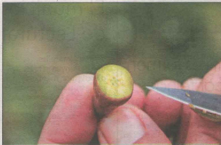
Una pera en la qual es poden veure els efectes de la gelada

L'import de l'ajut va de 15.000 i fins a 200.000 euros, sempre tenint en compte els ajuts de minims rebuts anteriorment. Aquest import es calcularà segons la dimensió del beneficiari i el percentatge de decrement del valor de la comercialització de la fruita de pinyol respecte d'un període de referència, que ha de ser de