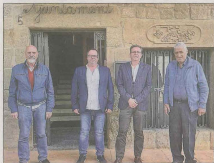
El president de la Diputació va visitar els municipis