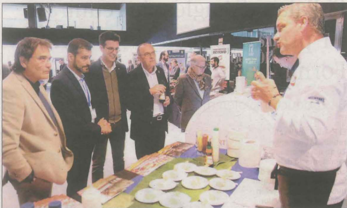
La Fira Horeca va ser inaugurada ahir al matí al Palau de Congressos de Lleida