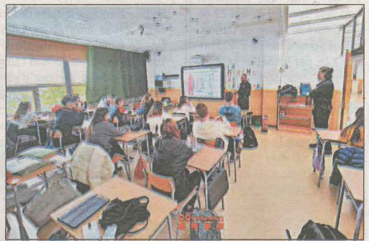
Moment de la xerrada que es va realitzar ahir

Prop de 500 professionals del Sistema d'Emergències Mèdiques (SEM) es donaran cita demà en la IV Jornada d'Emergències dels Pirineus, organitzada precisament pel SEM i l'Hospital Comarcal del Pallars. La Jornada es farà a l'Espai Cultural la Lira de Trep. L'objectiu d'aquesta és donar a conèixer els protocols d'emergències.