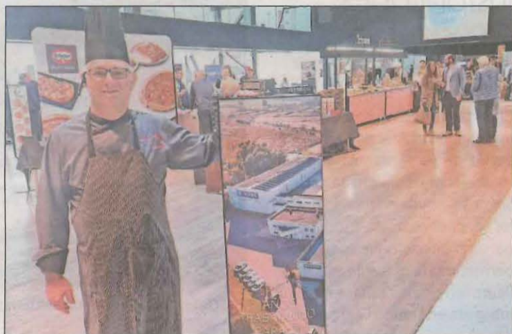
Un cuiner al costat del rètol d'entrada al recinte firal

La fira està formada per una desena d'estands, que mostren productes variats com coctails , pa, peix, pizzes, patates fregides, productes de bolleria, embotits,