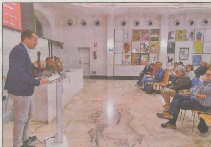
Imatge del Consell de Federació que es va celebrar ahir