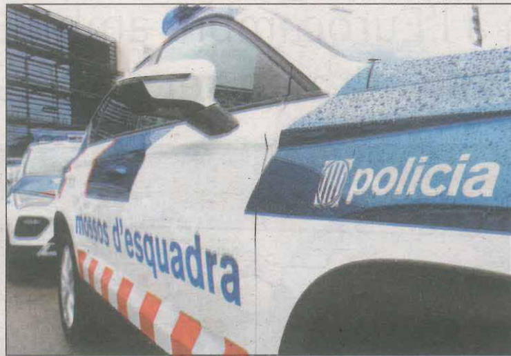
Els agents van trobar rellotges i joies al cotxe

Quan van arribar les patrulles van identificar i escorcollar els tres sospitosos i van revisar una