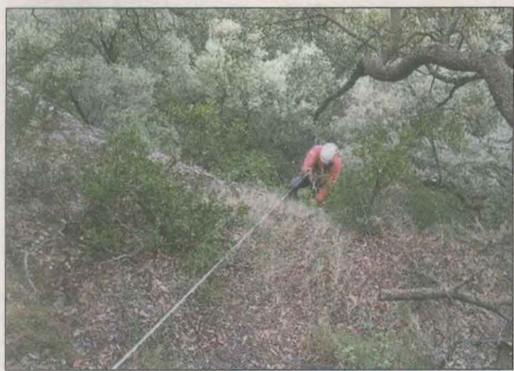
Un del efectius del GRAE a la zona Santuari del Lord

L'adequació de la fossa s'ha centrat en netejar l'entorn, consolidar el mur existent, també s'ha construït un nou mur de recalç i s'han col·locat un passamans de guia. A més, s'han instal·lat dos plafons explicatius, un a la porta del cementiri i un altre a la zona sud, amb una breu explicació per al visitant. Tanmateix, a l'interior del recinte, s'ha posat una capa superficial de sauló.