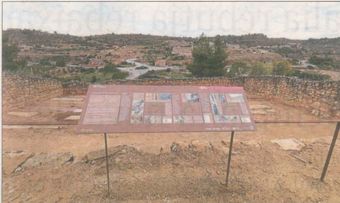
Un dels plafons informatius instal·lats al cementiri vell que acull la fossa de la Guerra Civil