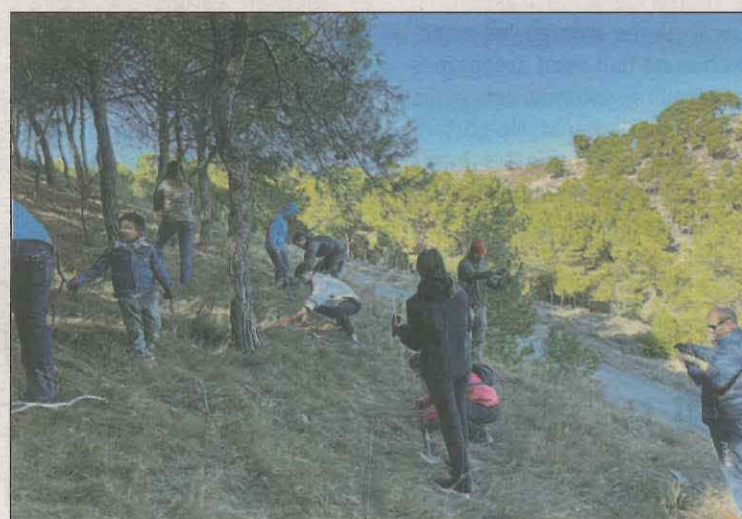
Imatge de l'activitat que es va fer el 19 de novembre

desenvolupament dels interessos econòmics de la comarca i fomentar l'emprenedoria amb la recerca d'inversions, programes i projectes".