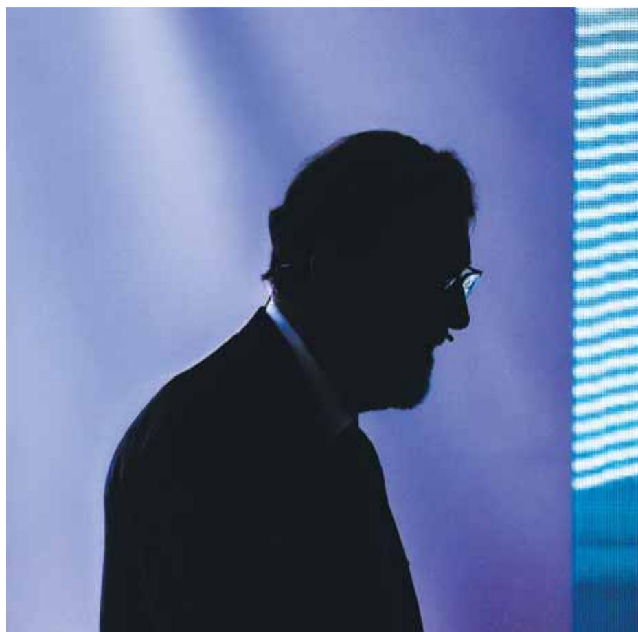
Mariano Rajoy, en un acte sobre canvi climàtic celebrat ahir a Buenos Aires

L'expresident espanyol ara té 15 dies per nomenar advocat. La seva declaració es pot dur a terme de manera presencial a Andorra, per videoconferència o en un jutjat de Madrid on es desplaçaria la magistrada del principat, auxiliada per un jutge d'instrucció. ■