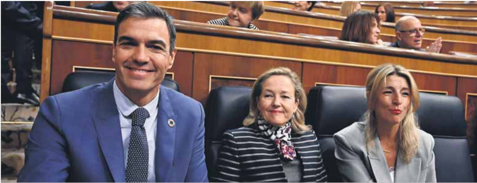
Sánchez i les vicepresidentes Calviño i Díaz, ahir, en el ple del Congrés moments abans de l'inici de la sessió de control al govern

■ El PP utilitza el president exiliat i “el nou senyor X” del govern contra el pla de reformar la sedició ■ El PSOE no reforma la llei del CGPJ ■ Marlaska nega l'ús policial de Pegasus en un xoc amb Vehí