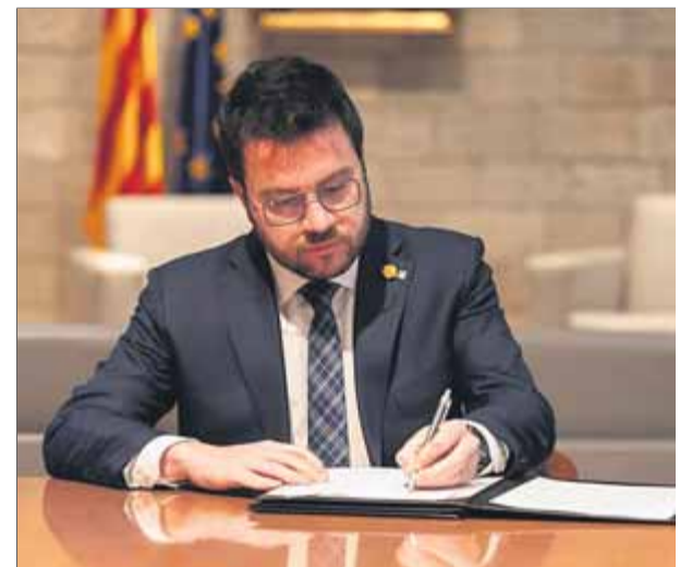
Aragonès, signant el decret d'impuls de la consulta, posteriorment suspesa

vern va obrir per als Jocs d'hivern no s'ha tancat, però no està en funcionament i “no representa cap cost per a la Generalitat”, atès que no s'ha contractat ningú per treballar-hi. La Moncloa interpreta que la consulta, d'àmbit pluricomarcal, s'empara en les competències catalanes. ■