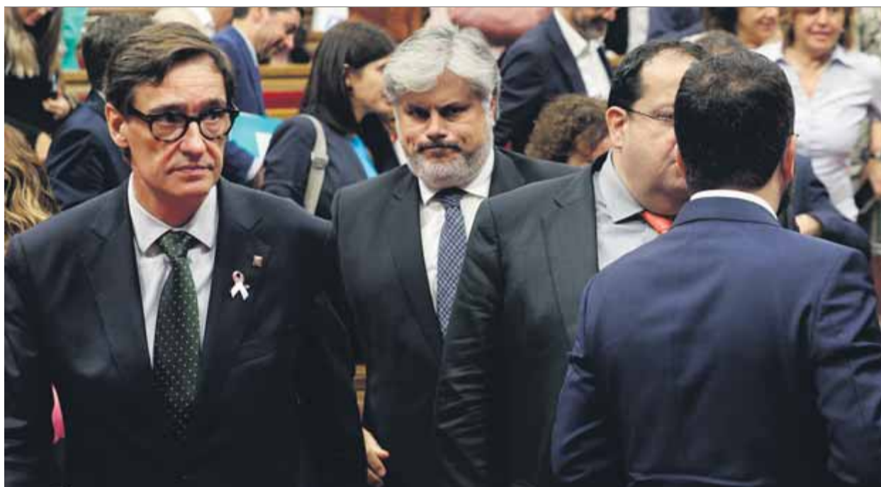
El cap de l'oposició, Salvador Illa; el cap de files de Junts, Albert Batet, i el president Aragonès, al Parlament