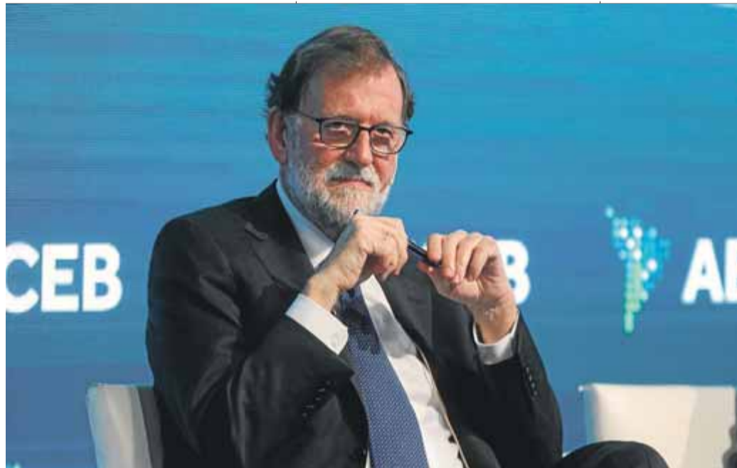
Rajoy intenta demorar el salt de defensar-se a Andorra per l'Operació Catalunya