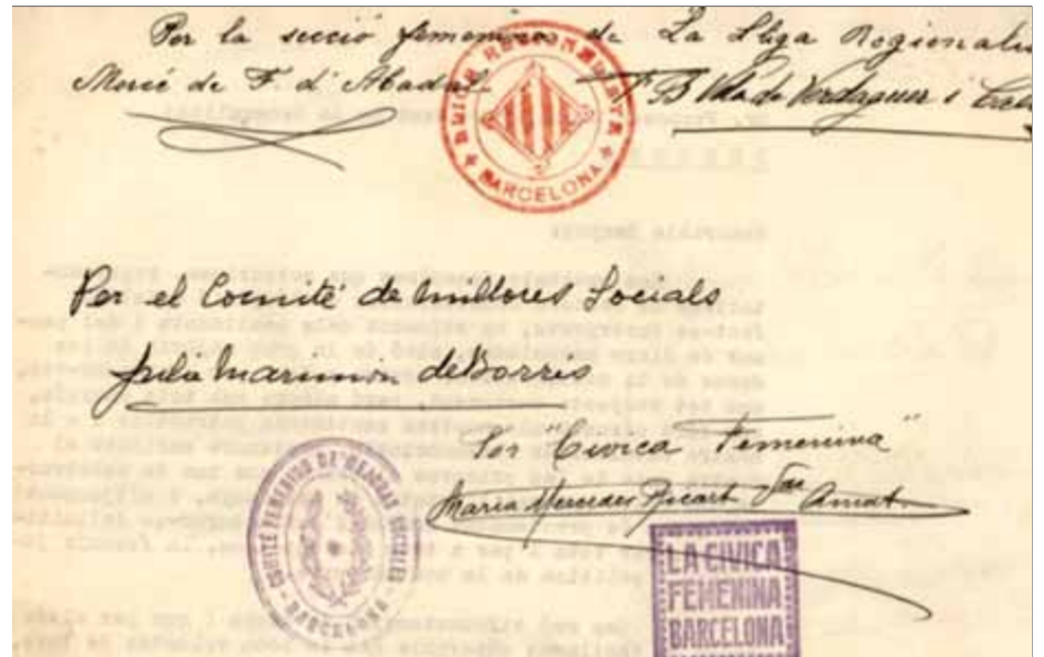
Membres de col·lectius femenins signen la carta a Macià reclamant el vot