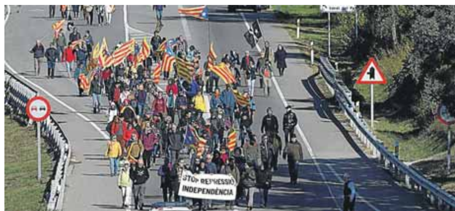
Els manifestants, a l'arribada a la Jonquera, on van fer parlaments

Entitats independentistes del Principat i de la Catalunya del Nord commemoren el tall de l'AP-7 per la sentència del procés En l'acte hi havia quatre encausades