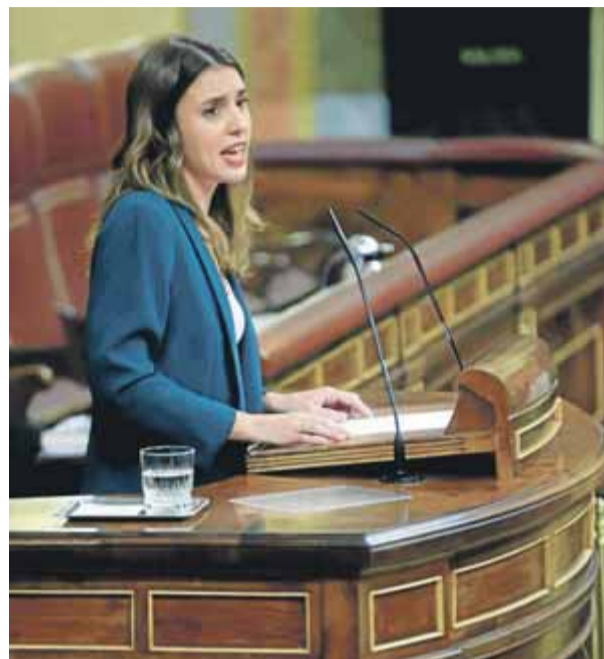
Montero (Igualtat) rebia ahir l'atac masclista de Vox

“Ministra alliberadora de violadors (...) Insultar qui passa anys estudiant dret quan l'únic mèrit que té vostè és haver estudiat en profunditat Pablo Iglesias.” És l'atac masclista que ahir al Congrés feia Carla Toscano (Vox) a la ministra Irene Montero. La titular d'Igualtat va exigir que l'atac resti al diari de sessions i es recordi la “violència política”. “Després de mi, cap més.”