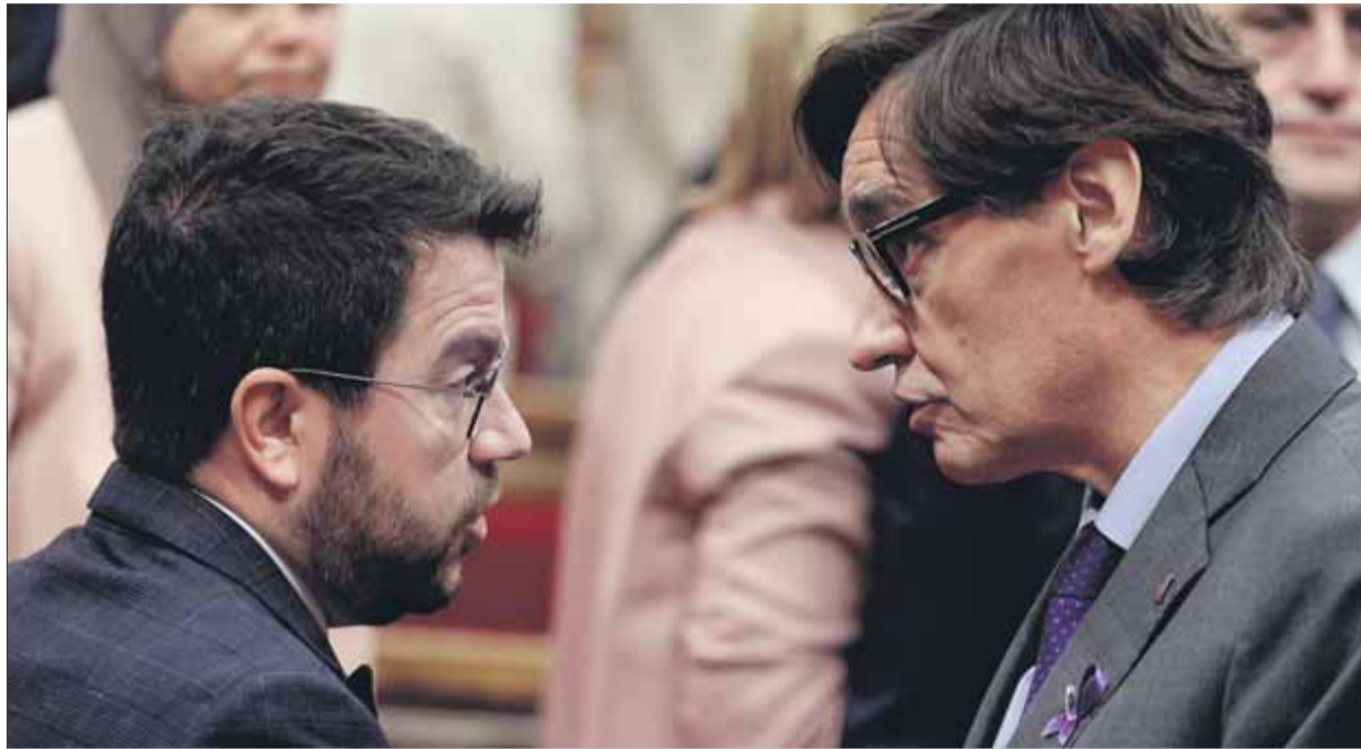
El president Pere Aragonès, amb el cap de l'oposició, Salvador Illa, ahir al Parlament

El president Pere Aragonès va estendre la mà ahir sense posar condicions al PSC en la negociació del pressupost del 2023 i, ja sense al·ludir a Junts i els comuns com a socis prioritars, el va situar en peu d'igualtat en les converses com a potencial aliat, per instar-lo a fer arribar les seves propostes a fi de "poder-les incorporar si hi ha acord". El president ho va oferir curiosament després d'una intervenció més indignada de l'habitual per part del cap de l'oposició, Salvador Illa, que es va queixar que no havien rebut tota la documentació sol·licitada, i que s'han assabentat "per tercers" del detall de l'esborrany de la llei d'acompanyament. "La documentació que tenim disponible se'ls ha fet arribar", es defensava Aragonès, que admetia que el text en qüestió s'ha tramès al Consell de Treball, Econòmic i Social de Catalunya (CTESC) i al Consell de Governos Locals, que agrupen diversos agents i entitats, perquè així ho marca la norma com a pas imprescindible abans que el Consell Executiu pugui aprovar el projecte de llei. Precisament, a la tarda