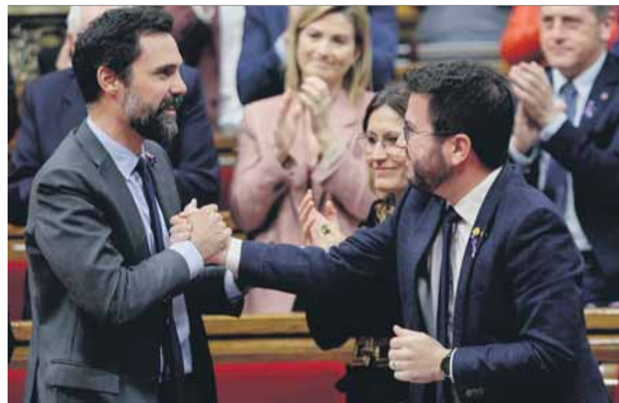
Torrent i Aragonès felicitant-se ahir per la resolució absolutòria del TSJC

RECURRENT • En més de 30 anys, temes semblants han anat al Parlament sense conseqüències GOIG • Gran part dels diputats van aplaudir en el ple d'ahir en saber l'absolució