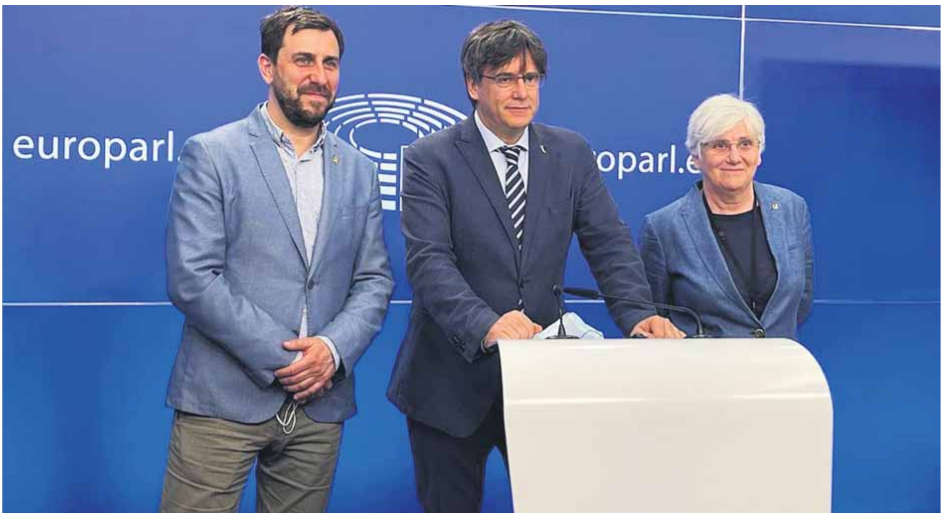
Comín, Puigdemont i Ponsatí durant una roda de premsa que van fer al Parlament Europeu poc després que se'ls retirés la immunitat, el març del 2021