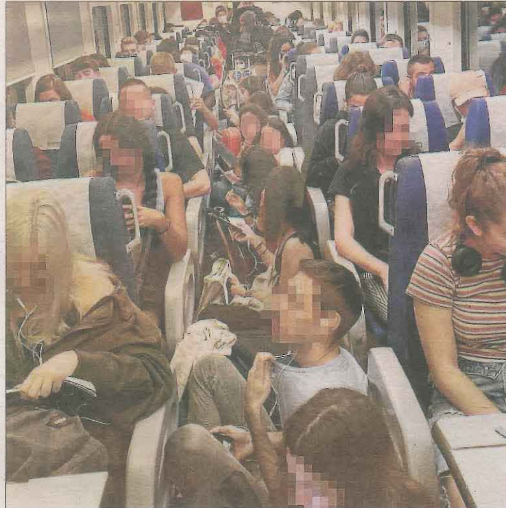
Usuaris asseguts al passadís en un tren de l'R-13 de dimarts.

bles. La fotografia es va fer viral. Usuaris del comboi afectat van assegurar que aquest problema es repeteix els caps de setmana des del setembre i ho van atribuir a la posada en marxa dels abonaments gratuïts de Renfe. Un d'aquests passatgers, que utilitza el tren entre Valls i Barcelona, va manifestar que "abans el tren no venia tan ple des de Lleida", encara que sí que hi havia ocasions en què "alguna persona havia d'anar dreta". Mentre esperaven l'arribada del tren ja ironitzaven preguntant-se "a