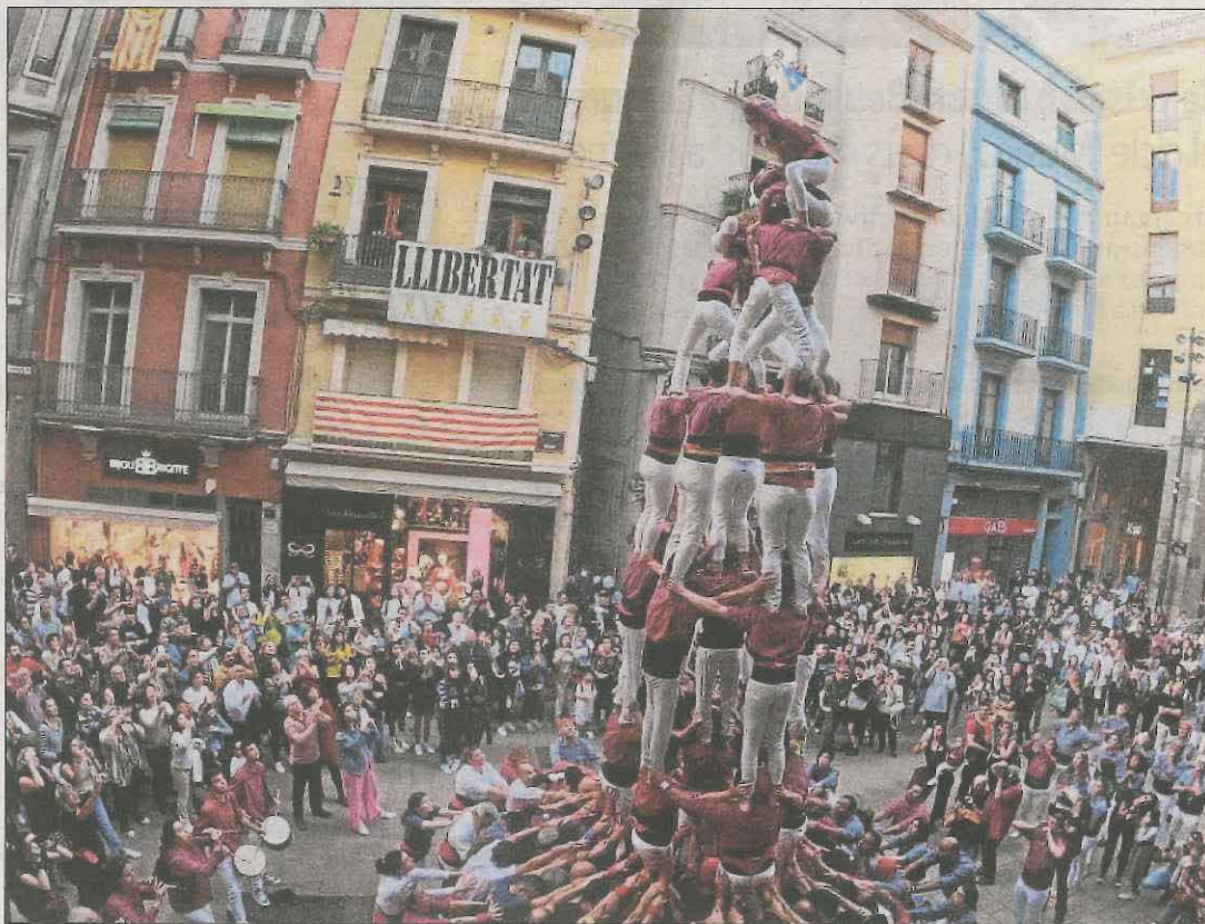
L'enxaneta coronant el castell.

Queda una setmana molt intensa i us convidem a tots a formar-ne part! Els Castellers de Lleida assagen al carrer Lluís Besa, 7. Els dimecres de 20 h a 22 h del vespre i els divendres de 21 h a 23 h.