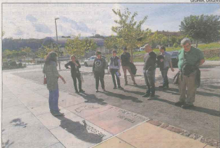
Visita a l'avinguda dels Temps Geològics de Tremp.