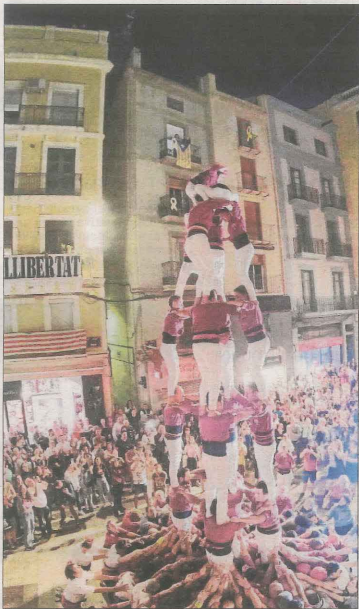
Imatge d'una de les estructures.

Els lleidatans van obrir plaça amb un ferm 7d7, el tercer de la temporada. Els castellers van mostrar un gran domini de l'estructura, que no va perillar en cap moment. Seguidament, la colla va apostar per intentar el 4d8, que es va quedar en intent desmuntat dues vegades. En el primer intent, l'estructura es va quedar a pocs segons de ser carregada. És possible que la colla el torni a intentar en properes actuacions. En segona ronda van descarregar un 5d7 impecable, i va ser una bona oportunitat per rodar castellers del tronc i del pom de dalt. Ja en última ronda van optar per fer el 4d7a, castell que porten fent tota la temporada i al qual tenen molta confiança. En ronda de pilars van descarregar un vano de 5 i 3 pilars de 4. Un va caminar fins al balcó i, quan l'enxaneta va ser fora, van anar pujant un per un tota