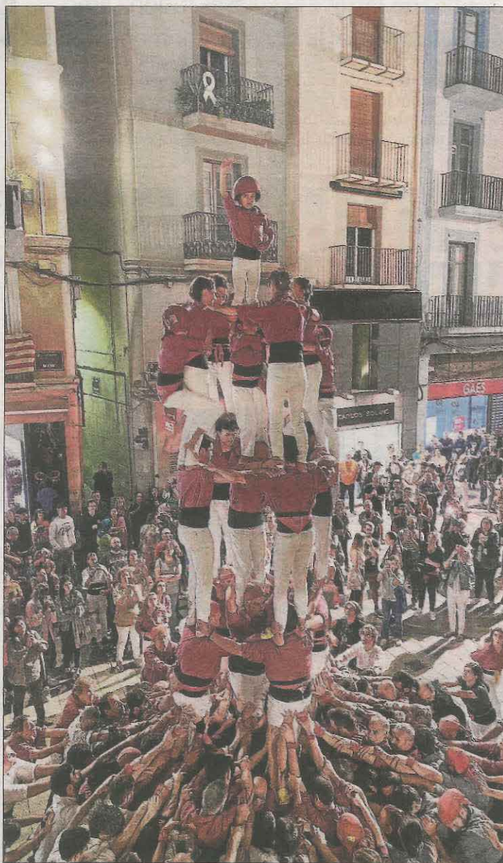
Els Castellers de Lleida amb un pilar carregat.