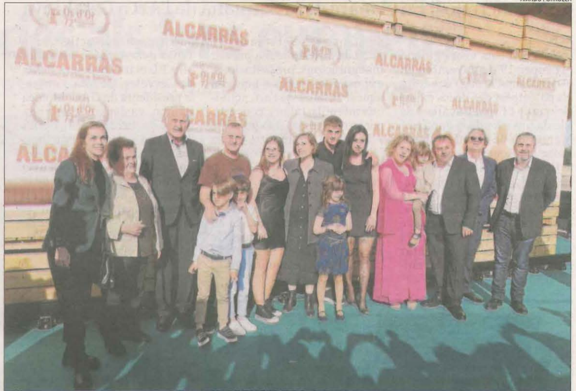
Preestrena el 26 d'abril a la Llotja de Lleida de la pel·lícula 'Alcarràs', amb la directora i els actors.

La cinta de Simón competirà pel màxim guardó continental amb la coproducció francobelgaholandesa Close , dirigida per Lukas Dhont; amb Corsa-