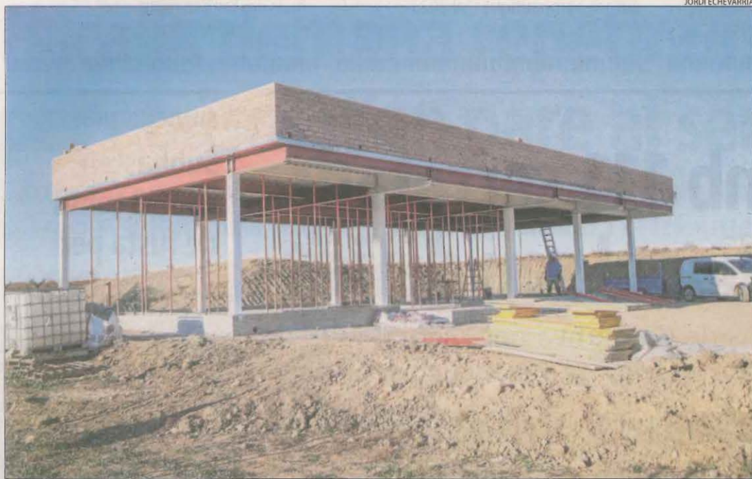
Les obres del nou edifici per a empreses del sector aeronàutic i aeroespacial a Alguaire.