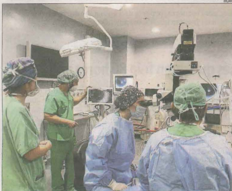
Especialistes del servei d'oftalmologia de l'Arnau de Vilanova.

El 40% dels metges rurals es jubila en els propers cinc anys, segons dades del Grup d'Eines per al Repoblament Rural, que agrupa pobles petits. Aquestes jubilacions provoquen preocupació perquè el relleu no està, ni de lluny, assegurat. En aquest sentit, la falta de professionals també va obligar Salut a cobrir les baixes de metges en pobles de la Segarra. Dos van demanar la baixa i un altre es jubilava. El departament va reconèixer les dificultats per trobar metges de família que vulguin traslladar-se en zones rurals. La conselleria treballa per reforçar el paper dels professionals sanitaris com infermers.