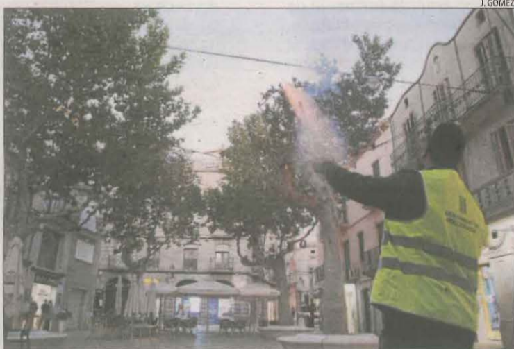
El llançament de la pirotècnia a la plaça Major de Mollerussa.