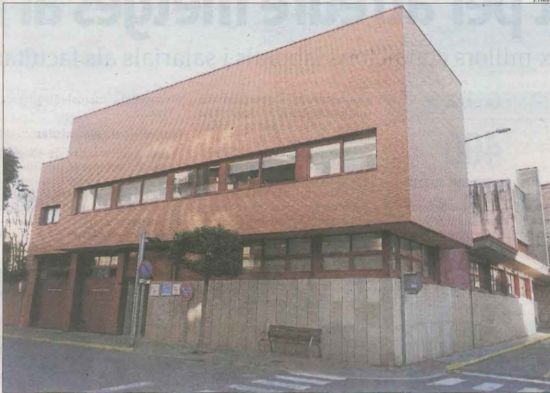
Imatge del Centre d'Atenció Primària (CAP) d'Artesa de Segre.

D'altra banda, el departament de Salut també va confirmar l'estiu passat a l'ajuntament de Rosselló que disposarà d'un pediatre fix a partir de l'any que ve.