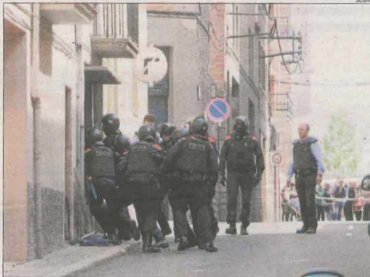
L'acusat es va atrinxerar el 2014 després d'apunyalat un veí.

de ser condemnat, li han d'aplicar l'atenuant de trastorn mental. Tanmateix, una forense va afirmar que no té les capacitats alterades. L'acusat va explicar ahir que, quan van tenir lloc els fets, feia deu mesos que estava lliure després d'haver estat set anys a la presó per una temptativa d'homicidi. L'acusat va ser condemnat a sis anys després que el 7 d'abril del 2014 apunyalés un conegut al garatge del seu habitatge a Tàrrrega. Li va assestar vuit punyalades i es va atrinxerar durant diverses hores fins que va ser detingut. Fiscalia també va recordar que té fins a sis causes obertes per assetjament, lesions i atemptat, entre altres delictes.