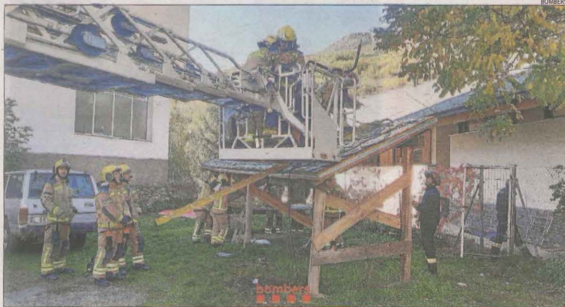
Imatge d'una pràctica en la qual van utilitzar l'autoescala.