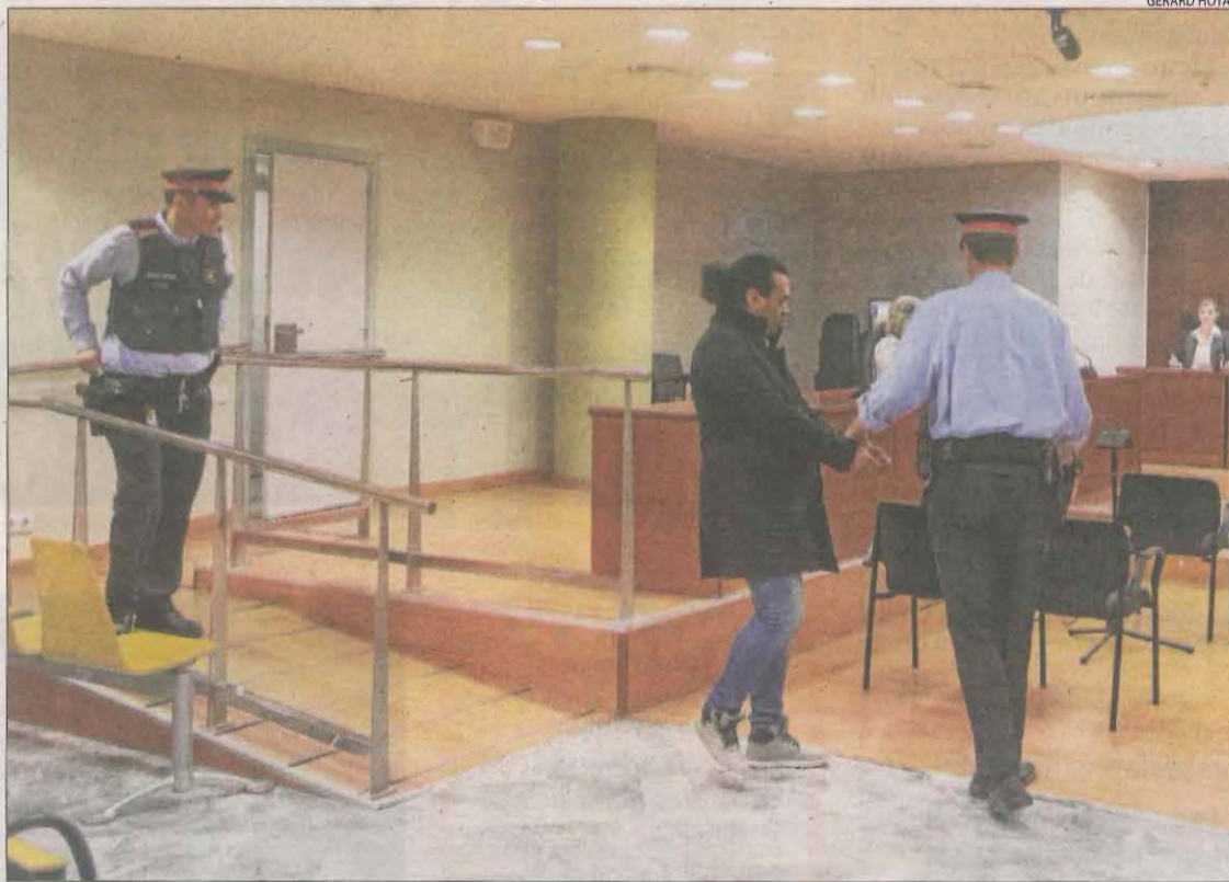
El judici es va celebrar ahir a l'Audiència de Lleida.

de ser condemnat, li han d'aplicar l'atenuant de trastorn mental. Tanmateix, una forense va afirmar que no té les capacitats alterades. L'acusat va explicar ahir que, quan van tenir lloc els fets, feia deu mesos que estava lliure després d'haver estat set anys a la presó per una temptativa d'homicidi. L'acusat va ser condemnat a sis anys després que el 7 d'abril del 2014 apunyalés un conegut al garatge del seu habitatge a Tàrrrega. Li va assestar vuit punyalades i es va atrinxerar durant diverses hores fins que va ser detingut. Fiscalia també va recordar que té fins a sis causes obertes per assetjament, lesions i atemptat, entre altres delictes.