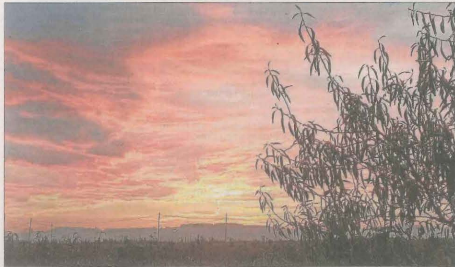
Posta de sol. Teresa Flix va captar aquesta bonica alba que presenta un espectacle de colors sobre uns camps.