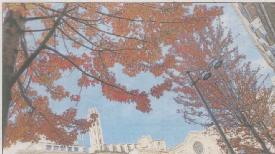
La tardor i la Seu Vella. Les fulles ataronjades decoren la plaça Sant Joan de Lleida, amb la Seu Vella presidint des de dalt en una imatge de Pep Manzano.

Les fulles cauen, arriba la boira i comença el fred. Envia'ns fotos sobre la tardor a cercle@segre.com o puja-les a la pàgina web (fins al 9 de desembre) i entraràs al sorteig d'un cap de setmana per a dos persones a l' Hotel Casa Irene d'Arties (Val d'Aran).