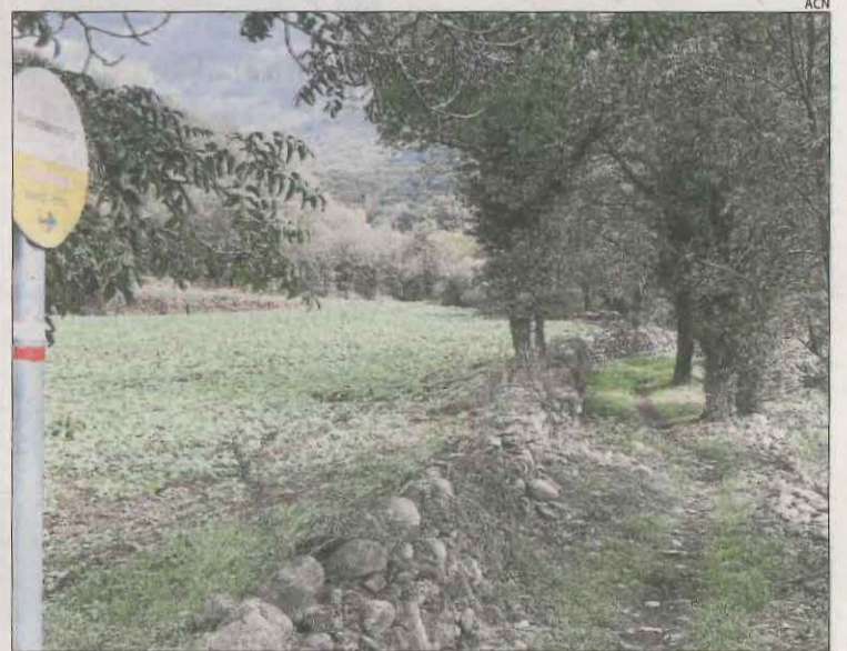
Un dels passos fronterers a l'Alt Urgell.