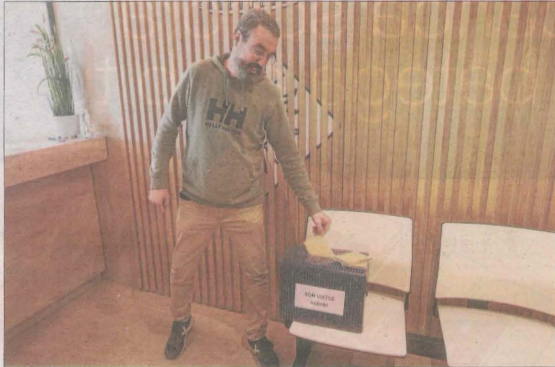
Un dels veïns de Soses que van participar ahir en la recaptació de diners per a la família del nen.

“El poble s'està abocant amb la família del petit. La veritat és que tots estem molt afectats, són una família molt vinculada amb Soses i això fa que tot sigui molt més dolorós per a tothom. Tot i així, des de l'ajuntament no podem fer cap altra cosa que donar les gràcies a tots els que estan