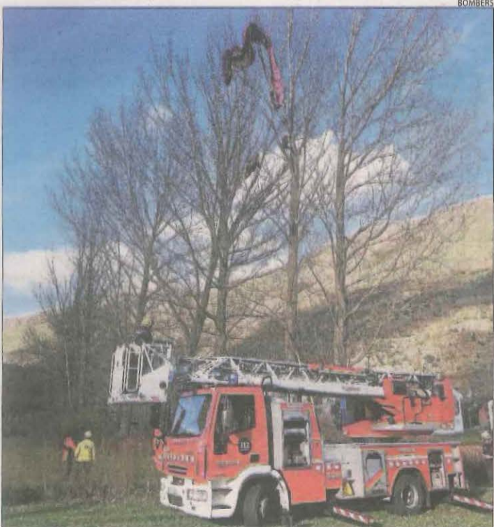
Parapentista atrapat en un arbre ■ Els Bombers van rescatar ahir a primera hora de la tarda un parapentista il·lès que es va quedar atrapat dalt d'un arbre a Esterrí d'Aneu.

BARCELONA | Asbovoca, l'associació de bombers voluntaris, va denunciar ahir al Parlament les “disfuncions” de l'actual model i va recordar que en deu anys “s'ha passat de 2.600 a 1.100 bombers voluntaris”.