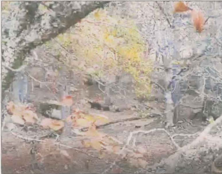
Fotograma del vídeo registrat diumenge passat.

El Conselh considera provada la presència a la zona d'almenys una ossa i dos cadells diumenge passat. Tanmateix, creu possible que els caçadors es trobessin dos vegades amb la mateixa femella i els seus dos cadells en llocs i moments diferents, i no amb