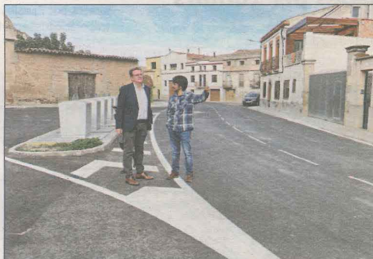
L'alcalde ha visitat recentment l'actuació

La Diputació de Lleida ha arranjat la carretera local LV-3321, que travessa el nucli urbà del Palau d'Anglesola. L'obra ha contemplat el traçat des del pavelló poliesportiu fins a la Novella Baixa, connectant amb la carretera de Linyola a Mollerussa. Ha posat l'accent en la millora de la seguretat viària, procurant reduir l'excessiva velocitat d'alguns vehicles.