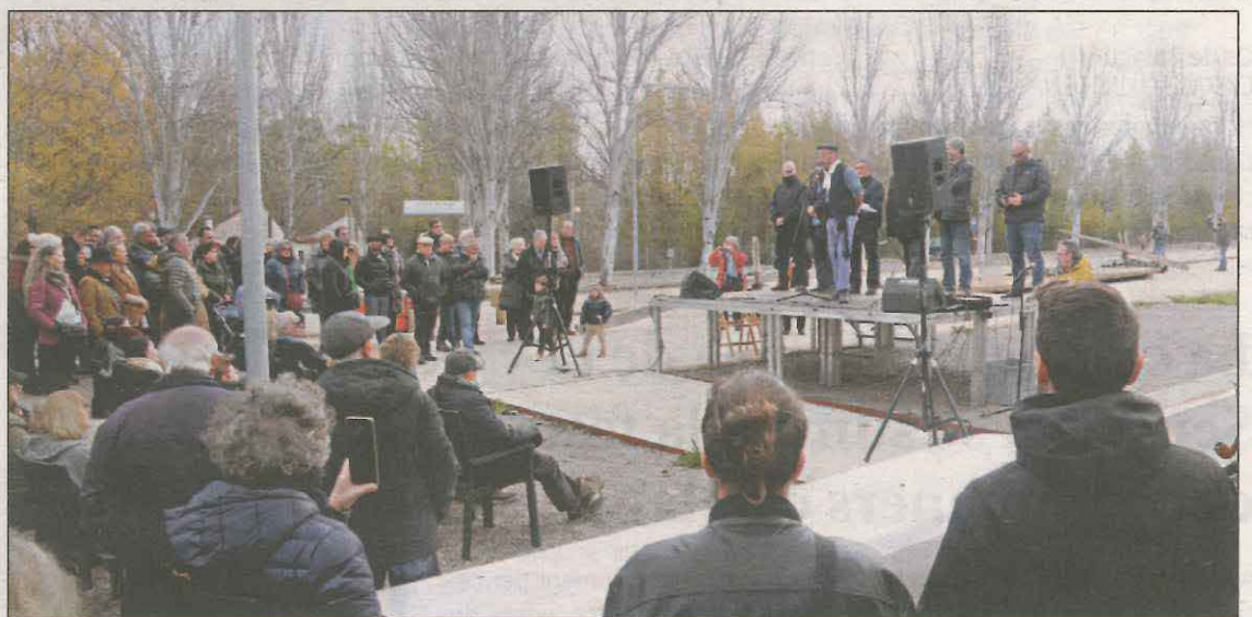
Un moment dels parlaments que es van fer al costat del futur Espai Raier

La Pobla de Segur ha estat el primer municipi dels Pirineus que ha celebrat la distinció de la Unesco de dijous als raiers. Ho va fer a l'hangar de l'estació de tren, espai que s'està reformant perquè aculli el nou Espai Raier. La previsió del consistori és que el nou equipament estigui en ple funcionament de cara a la propera Setmana Santa.