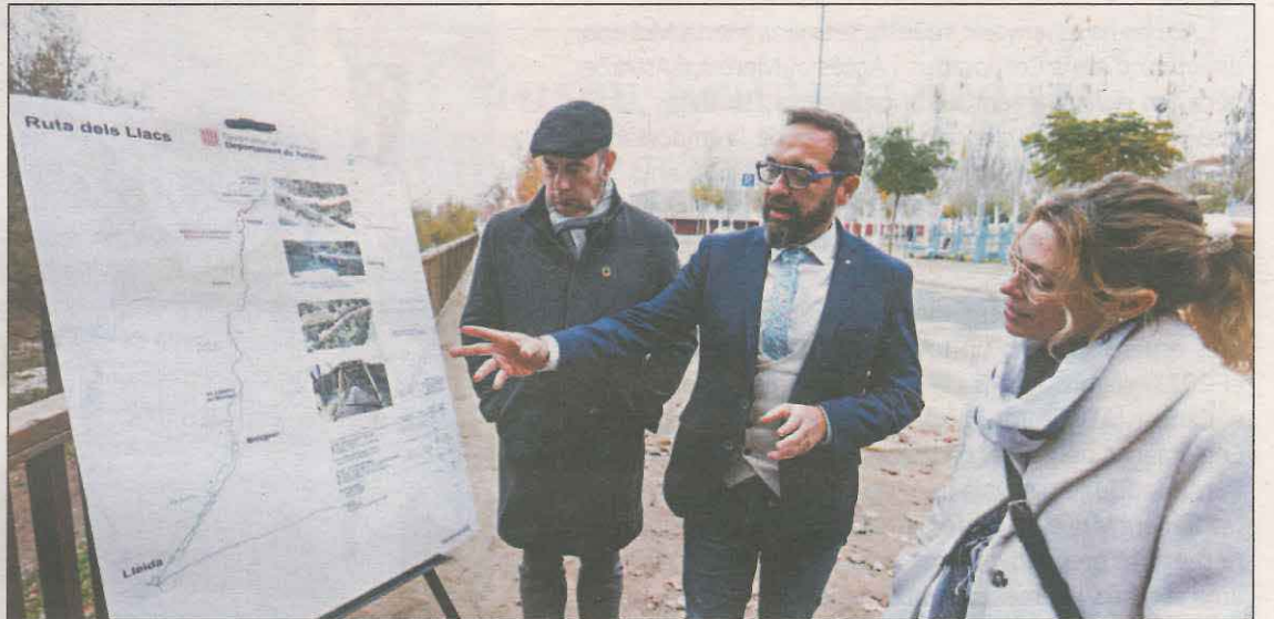
El conseller de Territori, durant la seva visita ahir a Balaguer

d'actuació de l'Estratègia Catalana de la Bicicleta 2025 és la promoció de l'ús de la bicicleta com a element turístic, d'oci i esportiu, de forma segura; així, el Departament de Territori està desenvolupant una xarxa catalana de rutes cicloturístiques de llarg recorregut, entre les quals hi ha la Ruta dels Llacs. El traçat de la Ruta dels Llacs transcorre per les comarques del Segrià, la Noguera i el Pallars Jussà, paral·lelament i complementària a la línia d'FGC Lleida - la Pobla de Segur, en un entorn d'alt valor paisatgístic. Un cop completada, tindrà 107 quilòmetres de longitud, dels quals 80 seran pedalables i els 27 restants —entre Sant Llorenç de Montgai i Cellers— es combinaran amb el ferrocarril. Els trams dels extrems, Lleida-Balaguer i Salàs de Pallars