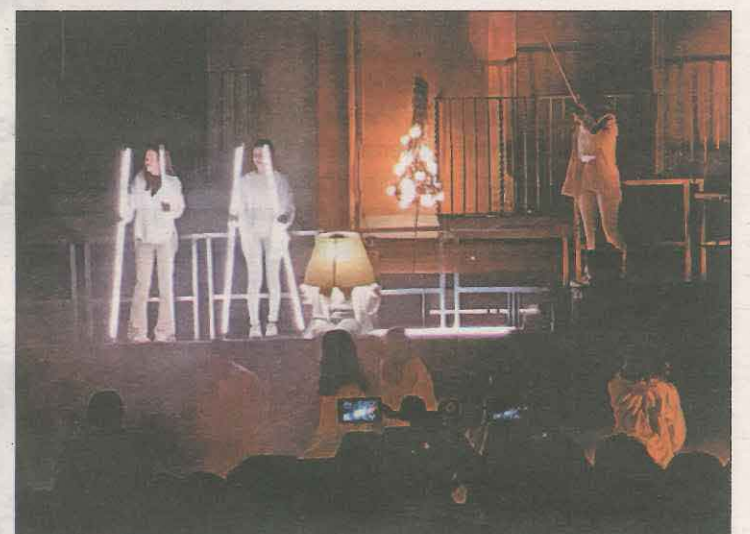
Imatge de l'espectacle teatral ahir

La millora d'aquest tram urbà d'aquesta carretera local, que creua la població del Palau d'Anglesola, millorarà la seguretat vial en aquest punt. S'han posat passos elevats per reduir la velocitat dels vehicles.