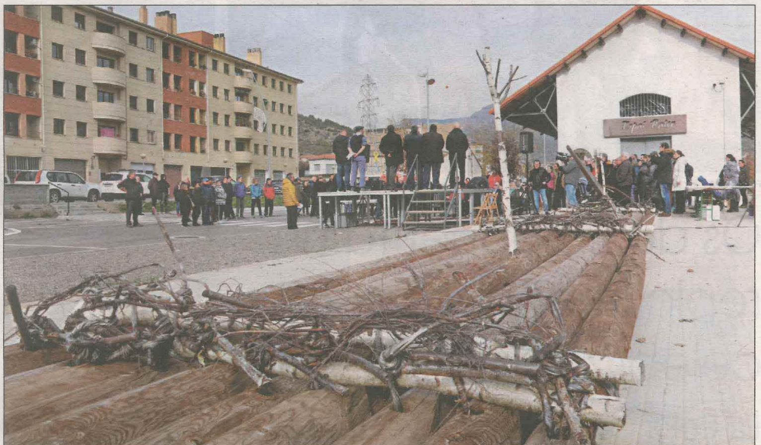
La Pobla de Segur va acollir ahir al migdia l'acte de celebració del reconeixement per part de la Unesco

Així mateix, Ferré va destacar que la distinció mundial, a més de