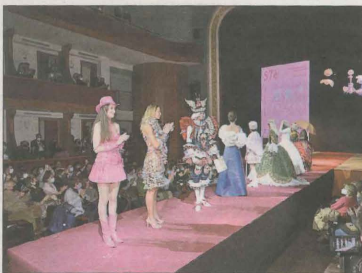
Imatge d'arxiu de la gala de l'any passat