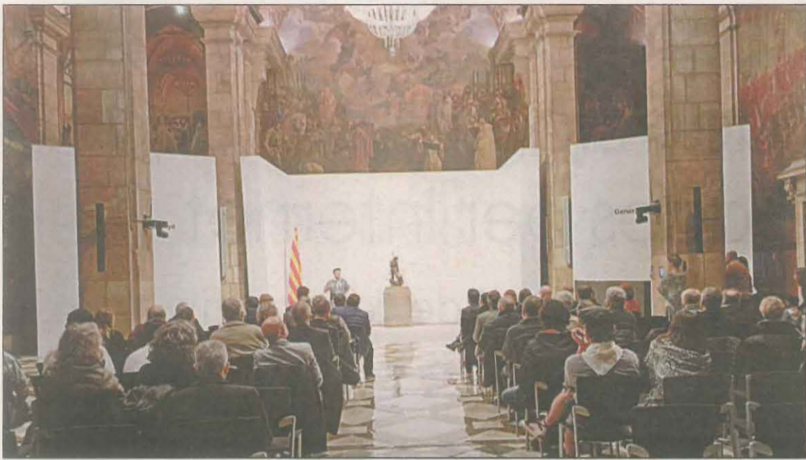
Representants dels raiers i dels campaners, ahir al Palau de la Generalitat