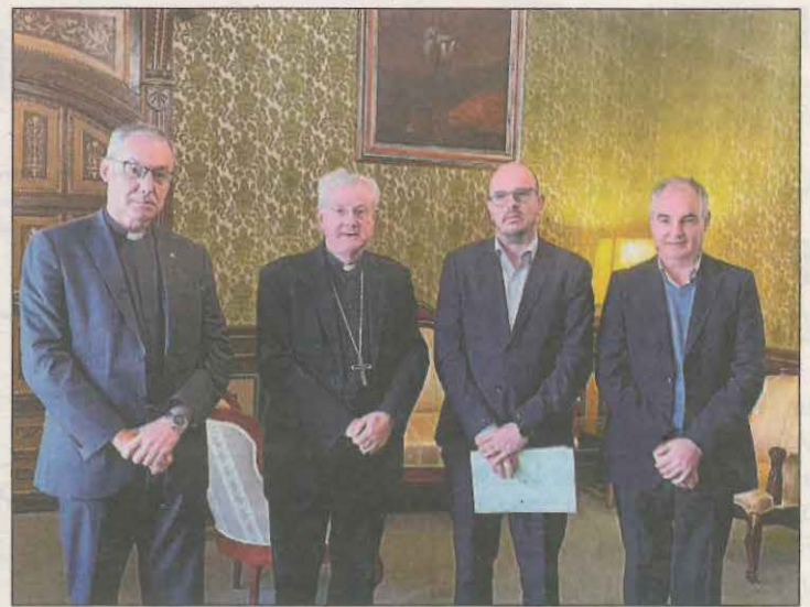
La Llar està vinculada al Bisbat d'Urgell