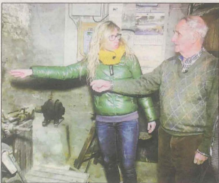
La periodista nascuda a la Seu d'Urgell