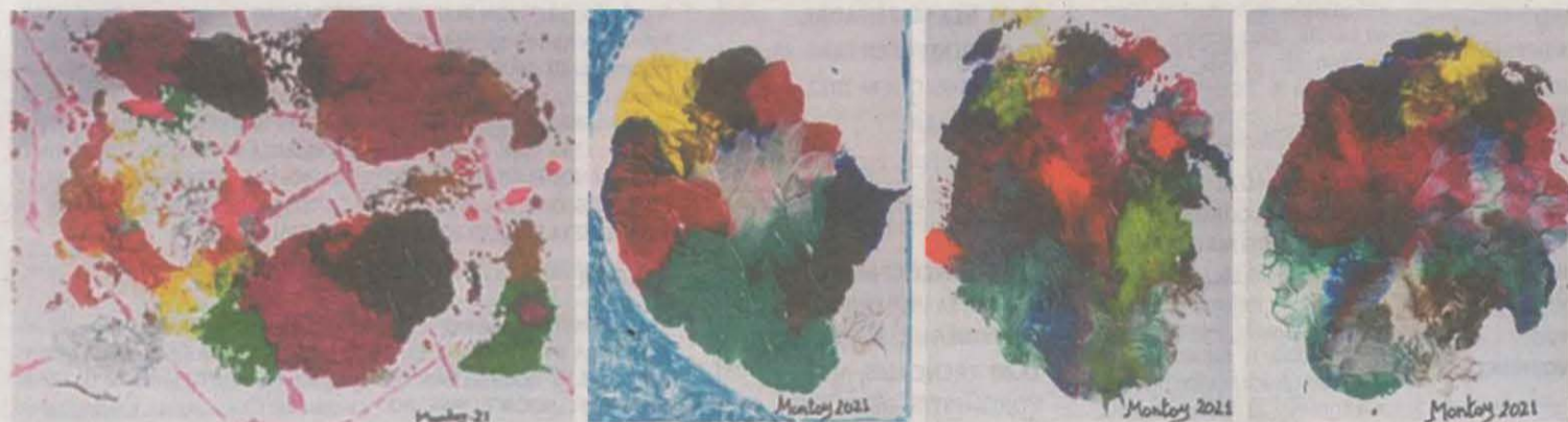
► MOMENTS DE CARÍCIES Mostra que va tenir lloc a la sala d'exposicions del casal d'Almacelles