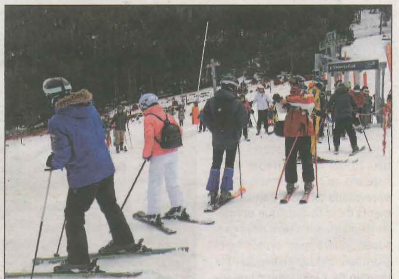
Imatge d'arxiu d'una estació d'esquí del Pirineu

s'acabarà l'any sense cap tipus d'acord. Per aquest motiu i després de descartar vagues per les Festes de Nadal, els treballadors s'estan plantejant mobilitzacions de cara al mes de febrer, quan té lloc la temporada alta de les estacions d'esquí. Els comitès d'empresa acusen FGC de negar la reserva d'una partida per pagar l'antiguitat dels fixes discontinus.