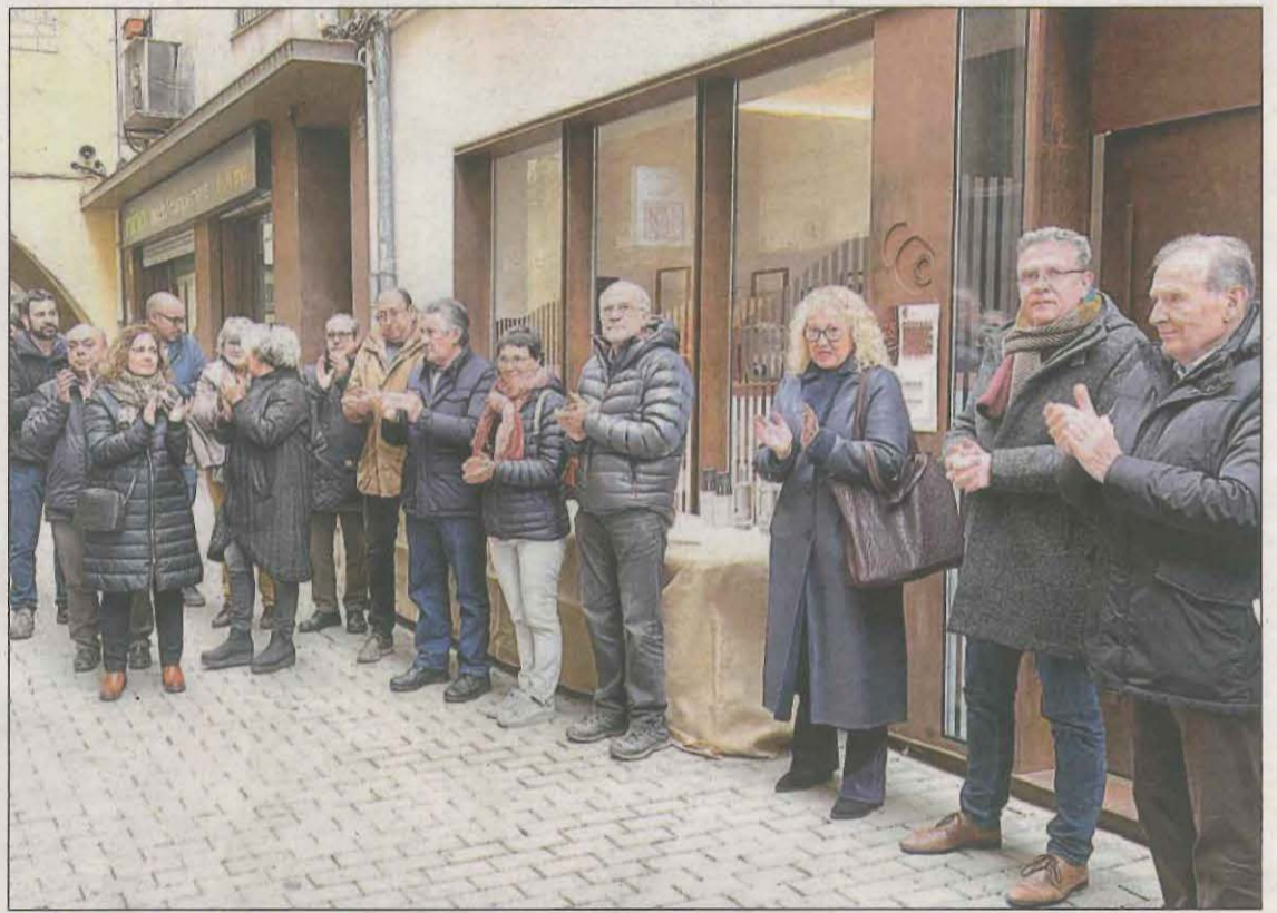
La nova oficina tècnica s'ubica als baixos de l'antiga Casa Potau

Per la seva banda, el president de la Diputació de Lleida, Joan Talarn, va dir que aquest projecte servirà per situar-se "al capda-