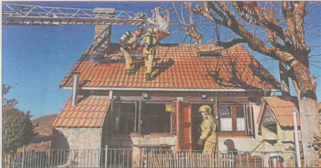
Els Bombers revisen la coberta de la casa afectada pel foc a Adons, al Pont de Suert