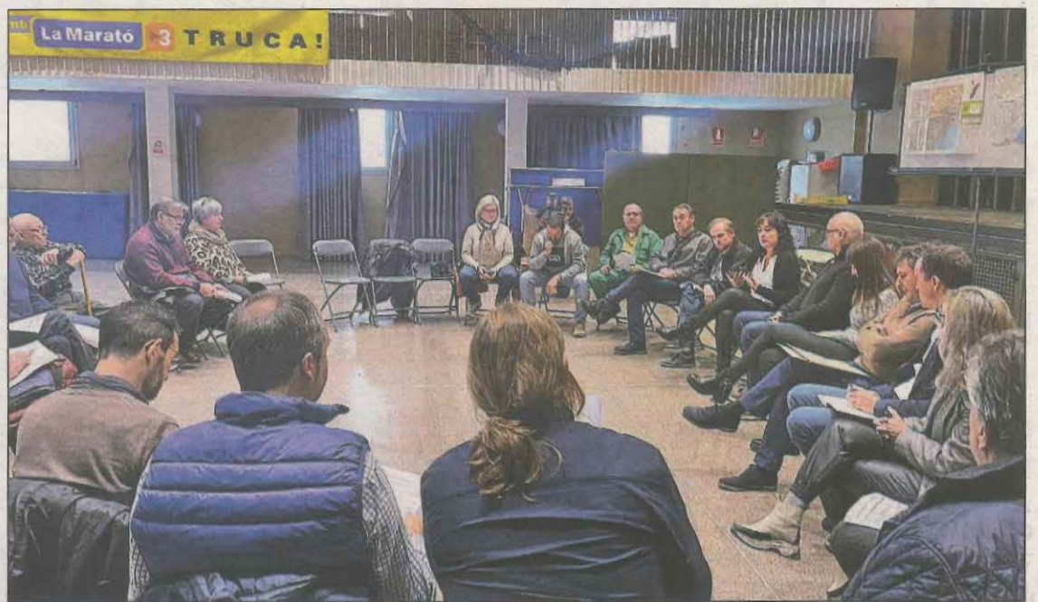
La trobada d'alcaldes amb diputats va tenir lloc ahir a Bovera

Aquesta maquinària es troba a Itàlia i és on van fer la prova de malta pallaresa entre el 2021 i 2022. En aquest període van enviar més de 5 tones d'ordi malter pallarès a Itàlia perquè el transformessin en malta i retornés. Aquesta primavera el malt pallarès va arribar i 5 cervesers artesans del territori l'han provat amb resultats molt positius.