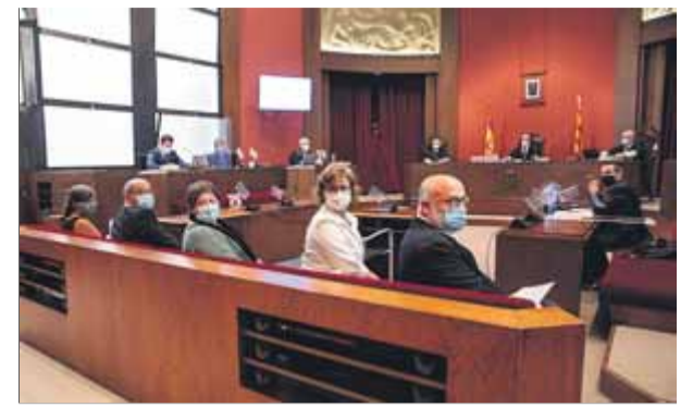
El primer judici es va fer el juliol del 2020

Ahir el PSC no en va parlar i Junts va dir laconicament que no hi havia novetats des de dilluns, quan va deixar clar que encara veu “lluny” l’acord. Després de més trobades dilluns passat, no hi va haver reunions ahir, i avui n’hi torna a haver de previstes, ja, doncs, en la recta final. Entretant, ERC demà segurament oficialitzarà l’aval al pressupost de Barcelona. Favés comptades. ■