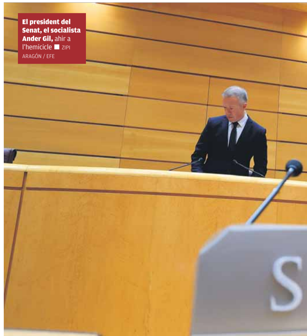
El president del Senat, el socialista Ander Gil, ahir a l'hemicicle

Tot i que la seva indignació es va reflectir en l'ús de la paraula complot (suau sinònim de cop d'estat ) a Brussel·les, el president espanyol no ho va repetir ahir a La Moncloa per no