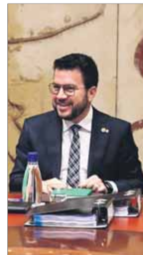
Pere Aragonès, ahir, en el consell executiu