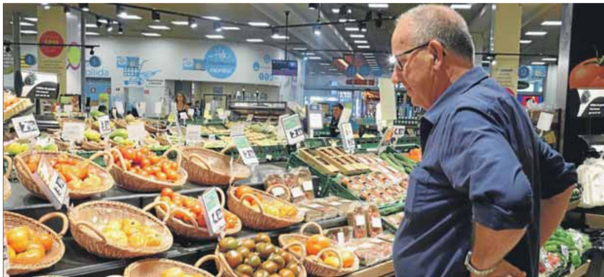
Fruites i verdures hauran de tenir una referència nova amb el preu ja sense IVA a partir de l'1 de gener ■ ACN

El prolix decret —de 125 pàgines— amb els punts del pla de xoc va ser publicat ahir al BOE, i el seu article 73.2 deixa clar que la vigilància de preus serà una obsessió de La Moncloa: “La reducció del tipus impositiu beneficiarà íntegrament el consumidor [...] sense que l'import de la reducció pugui dedicar-