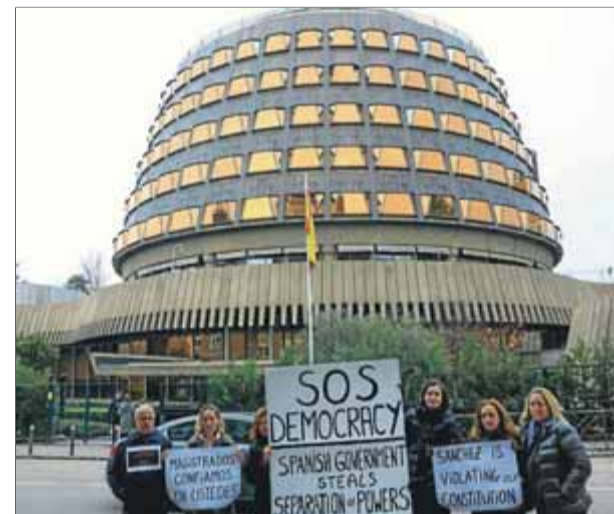
Manifestants ultradretans a les portes del TC el 19 de desembre, exigint que l'alt tribunal aturés Sánchez