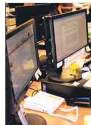
Imatge d'arxiu de la secció administrativa dels jutjats de Reus.

Els ciutadans ja poden presentar demandes, per reclamar diners, i escrits en línia sense necessitat de desplaçar-se als jutjats. El Departament de Justícia, Drets i Memòria va informar ahir que el sistema ja s'aplica des del mes de novembre a través de la Seu Judicial Electrònica de Catalunya. Es poden aportar demandes als judicis monitoris –quan es