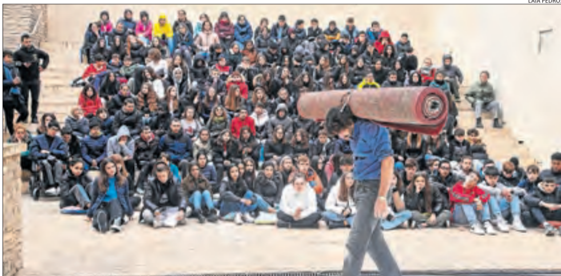
Estudiants de 3r i 4t d'ESO de centres educatius de Tàrrrega van gaudir ahir de teatre al carrer.

| LLEIDA | L'espai teatral La Saleta de Lleida, al carrer Ballester, acollirà avui (19.00 hores, 10 €) l'espectacle Isadora , a càrrec de la companyia madrilenya El Montacargas. L'obra de teatre, música, dansa i audiovisual repassa la figura i el pensament d'Isadora Duncan (1877-1927), ballarina feminista, musa i pionera de la dansa contemporània.