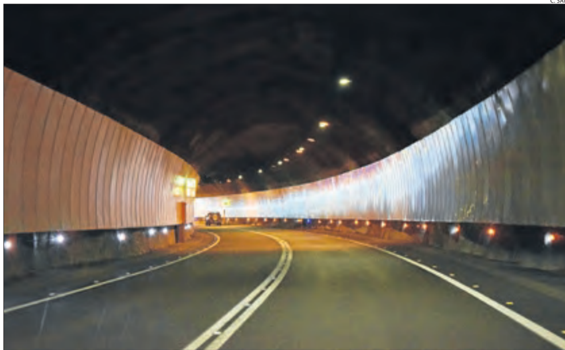
L'interior de la galeria de Montant de Tost, on s'han instal·lat plafons que milloren la visibilitat.