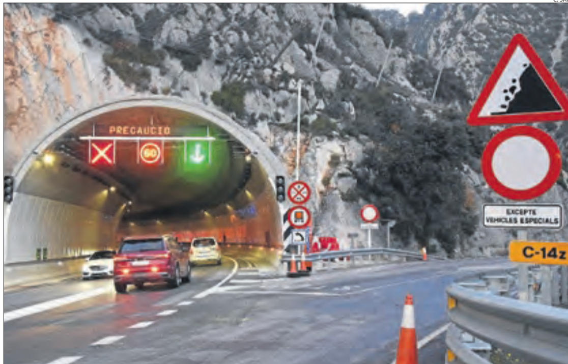
La boca sud del túnel de Trespunts, amb els senyals que marquen les restriccions.

D'altra banda, ahir al migdia també es va restablir el trànsit al túnel de Montant de Tost, a la C-14 i pròxim al de Trespunts. Ha estat tancat més de dos setmanes per obres per revestir l'interior amb plafons que reflecteixen la llum i milloren la visibilitat a l'interior. En un altre ordre, el Govern central ha acabat obres de millora al túnel de Vielha i en tres més de l'N-230, amb una inversió de 2,5 milions d'euros.