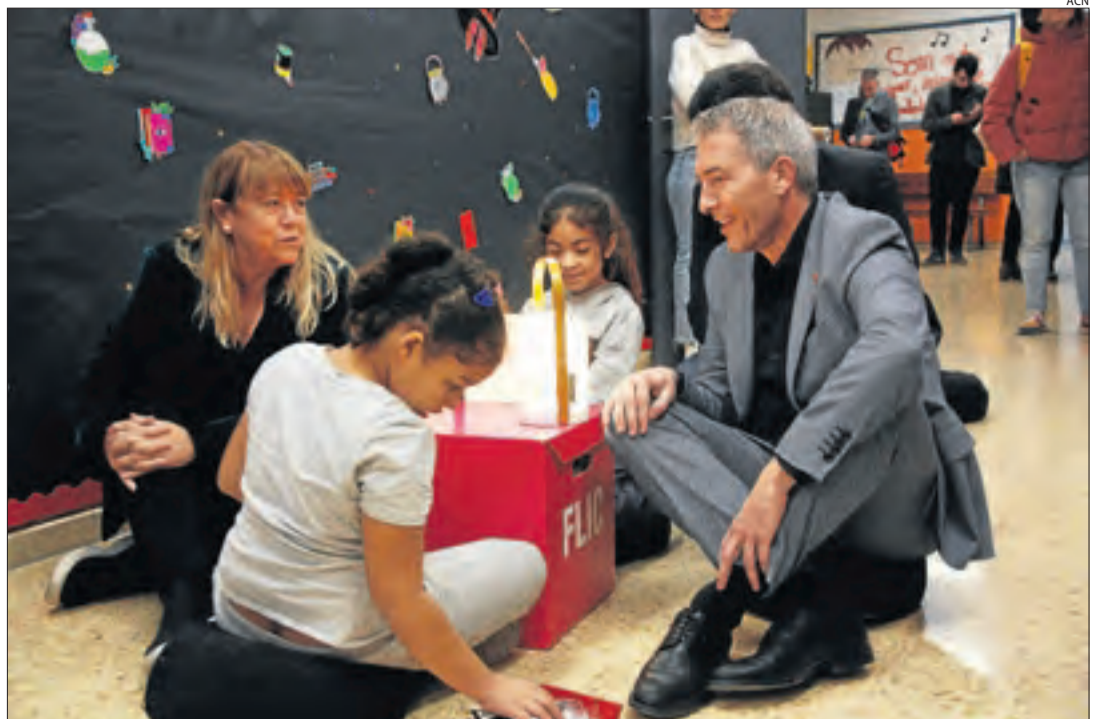
Els consellers de Cultura i d'Educació, ahir en una visita a una escola de Sant Feliu de Llobregat.