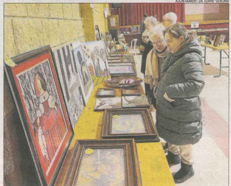
Imatge de la primera edició del mercat de Torre-serona.

TORRE-SERONA | Torre-serona va celebrar ahir la primera edició del mercat d'oportunitats i de segona mà. Els visitants van poder trobar multitud d'objectes, com per exemple roba o joguets, a preus que van oscil·lar entre 1 i 5 euros. Per amenitzar l'acte, hi va haver una desfilada de vestits de núvia d'època cedits per veïnes. L'ajuntament va assegurar que, arran de la bona resposta del públic, organitzarà una altra edició el 2023.