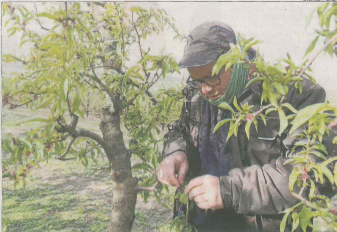
Un agricultor, analitzant els danys a la seua finca després de les gelades de l'abril passat.

L'ajuda per hectàrea de cada sol·licitant es multiplica pel grau d'afectació establert a l'acta de peritatge corresponent a cada explotació. En el cas de les