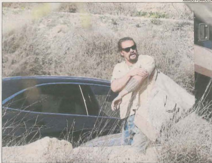
Jason Momoa, durant la gravació a Sant Llorenç de Montgai.

L'argument de The Climb consisteix en la competència entre deu escaladors i escaladores amateurs per obtenir un premi de 100.000 dòlars i un patrocini de la firma de roba d'aventura i viatges prAna per convertir-se en professional de