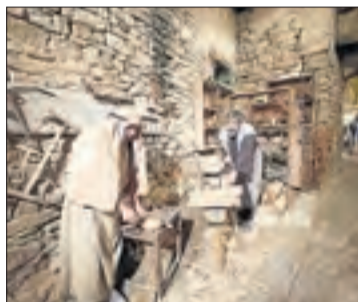
Sant Guim fa funció els dies 26 i 7, 8, 14 i 15 de gener.

Linyola enguany no en fa a causa d'obres al municipi.