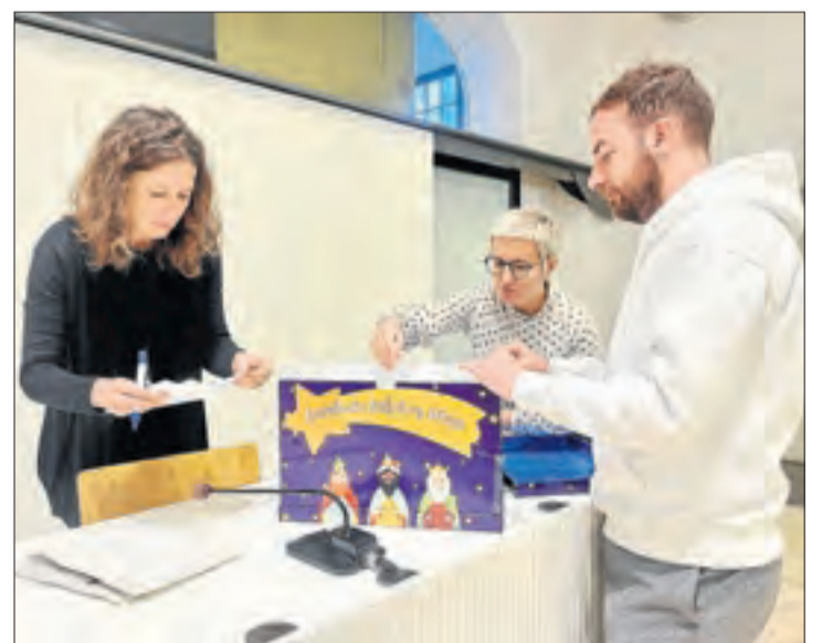
El sorteig es va celebrar ahir a la sala Alfred Perenya de Lleida.