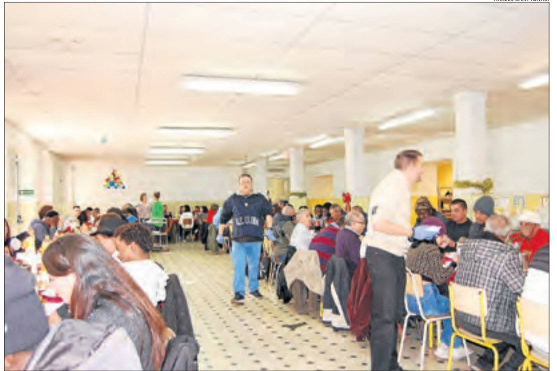
El menjador del col·legi Maristes Montserrat va acollir el dinar de Nadal solidari.