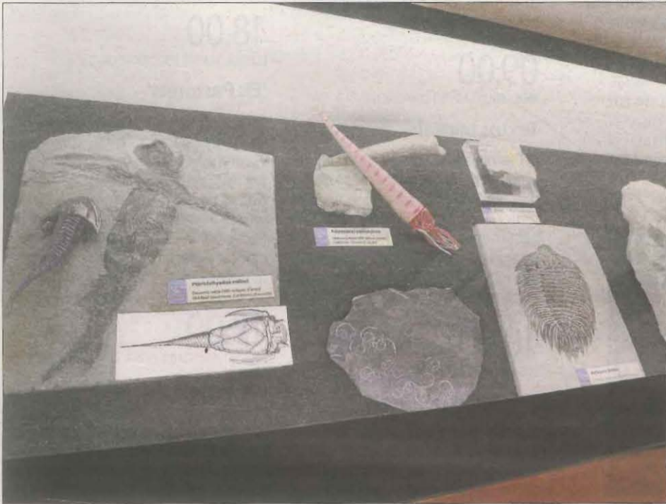
Una de les vitrines, amb fòssils d'artròpodes de 400 milions d'anys i la recreació.

El lleidatà Julio Pocino ha reunit al llarg de la vida milers de fòssils originals i reproduccions procedents de tots els continents, que conserva en un 'museu' particular || Una 'geosala' per a la qual ha sol·licitat autorització a la Paeria de cara a obrir-la a visites i activitats pedagògiques