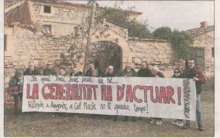
L'acte reivindicatiu per exigir que s'actui a Vallmanya.

INICIATIVA POPULAR SALVEM CAL MACIÀ-CASA VALLMANYA