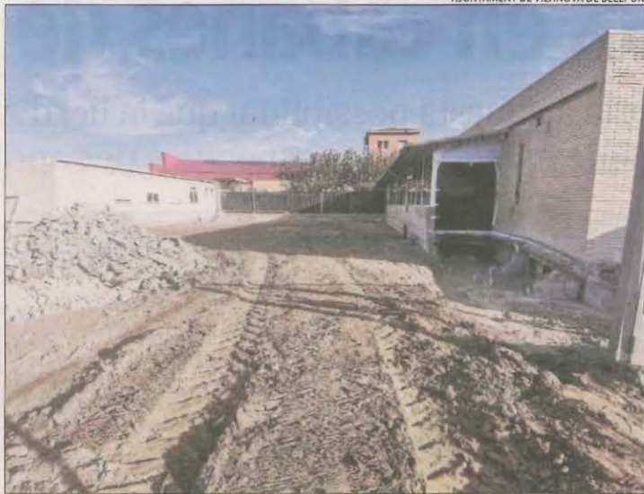
Els primers treballs a la zona.

Els primers treballs han inclòs el desmuntatge de les tanques perimetrals per poder accedir a la parcel·la i la