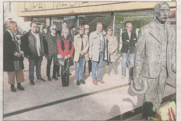
Acte d'homenatge a Francesc Macià a les Borges diumenge.