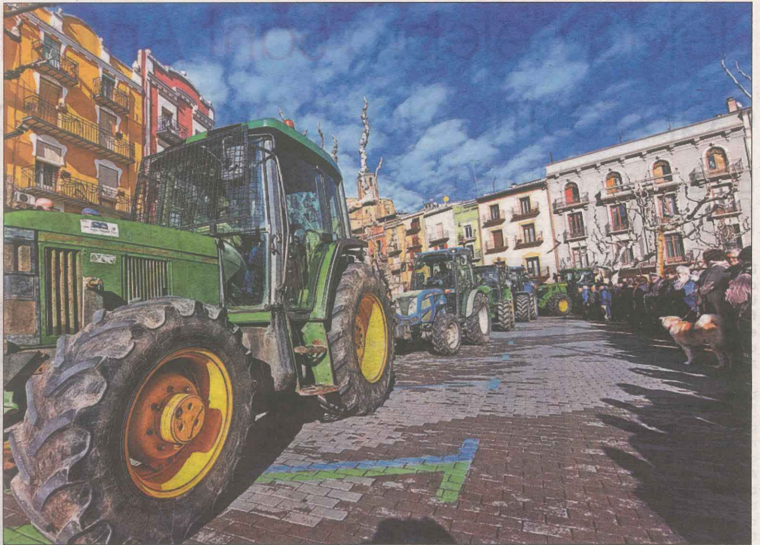
Un total de 90 tractors van participar en la celebració de Sant Antoni Abat a la plaça del Mercadal de Balaguer

La demarcació de Lleida va celebrar ahir la festa de Sant Antoni Abat amb una lluita jornada en què, per exemple, la Seu d'Urgell va recuperar la tradicional calderada en què es van repartir unes 9.000 racions d'escudella. La coral Veus de la Seu va interpretar els goigs de Sant Antoni. A Balaguer, un total de 90 tractors i quatre carrosses van participar en els Tres Tombs a la plaça del Mercadal. La jornada també va comptar amb la benedicció dels populars panets de Sant Antoni, la missa a l'altar del Sant a l'església de Sant Josep i la benedicció als animals. A Butsènit d'Urgell diversos tractors i maquinària agrícola van desfilant pels carrers, com també ho van fer a Tremp.