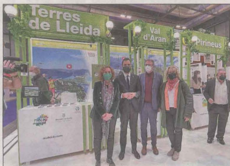
Imatge de Fitur a l'edició del 2022

Aquesta nova edició de Fitur recupera enguany la plena normalitat i per primera vegada en els darrers tres anys estarà exempta de restriccions sanitàries. Fitur 2023 tindrà com un dels principals focus d'atenció la sostenibilitat, i les comarques de Lleida també presentaran les seves propostes i projectes en els quals s'està treballant en aquest àmbit. Així, cal destacar que aquest any l'Observatori de sostenibilitat, Fitur Next, té pre-