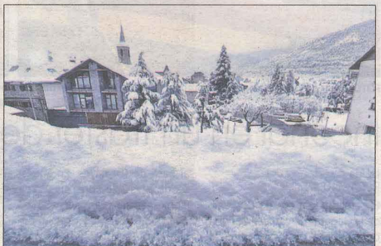
La nevada també va ser copiosa a la Vall Fosca (esquerra). A la dreta, una foto d'ahir d'Esterrí d'Àneu