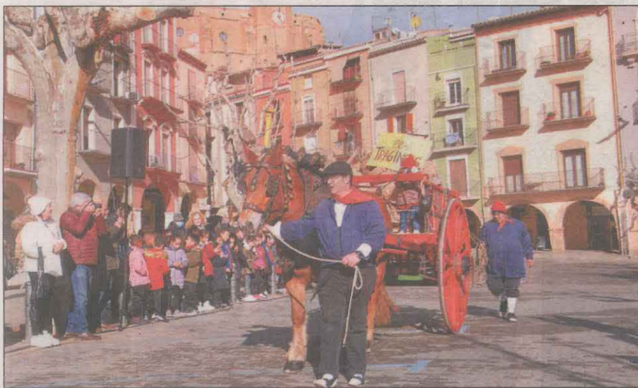
Un tragner acompanyat del seu cavall a Balaguer