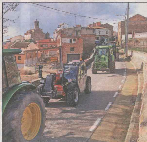
Maquinària a Butsènit d'Urgell