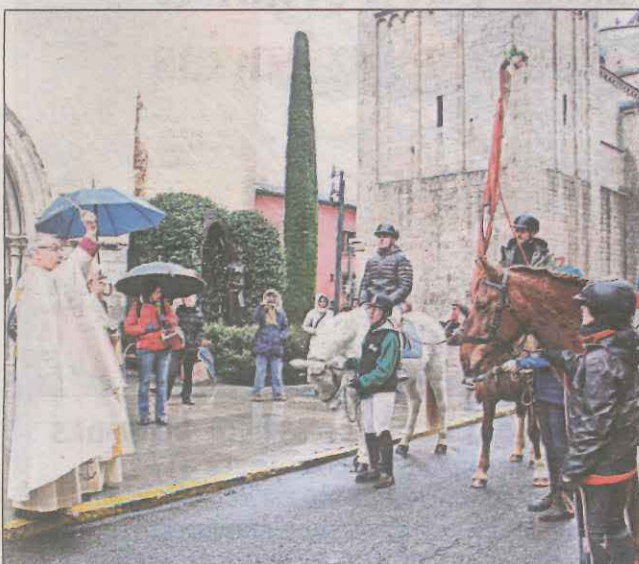
Benedicció dels animals a la catedral