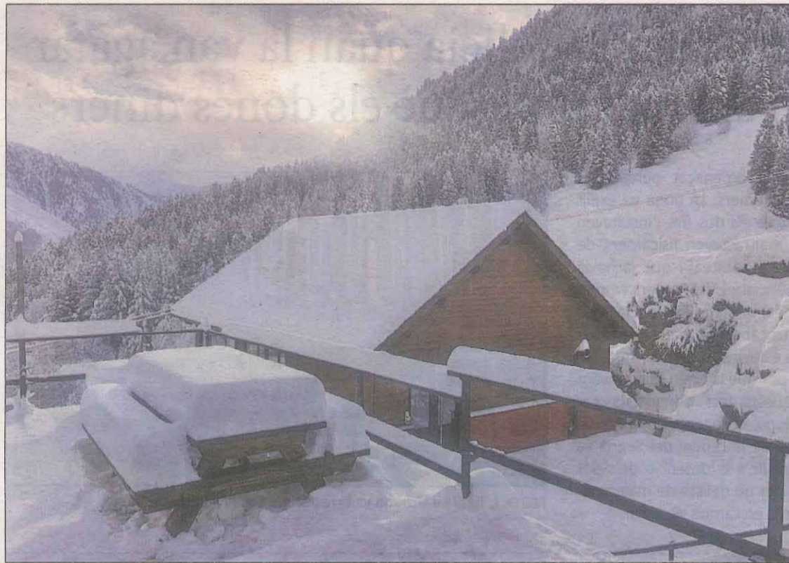
La Pleta del Prat de Tavascan, on hi ha l'estació alpina de la població, es va despertar ahir així

La neu permetrà ara que els complexos hivernals del Pirineu i el sector turístic en general encarin un final de temporada d'hivern amb més optimisme.