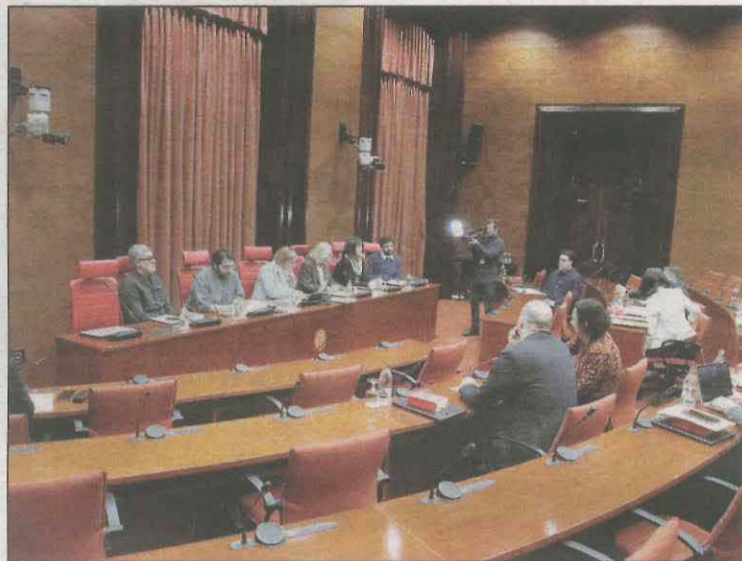
Reunió de la Junta de Portaveus celebrada ahir