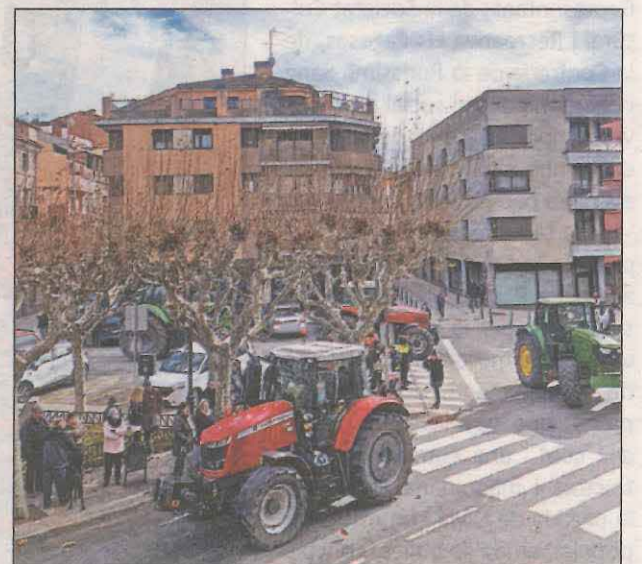
Tractors desfilant pels carrers de la vila