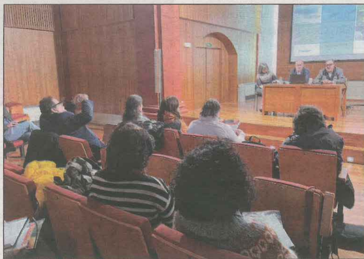
Presentació de les nou línies d'ajuts per al sector

Així, es poden sol·licitar per calcular la petjada ambiental de producte, crear obradors compartits, millorar l'eficiència de petits escorxadors, fomentar projectes transformadors i arrelats al territori, prevenir pèrdues i el malbaratament alimentari, in-