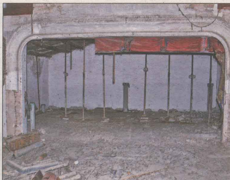
Estat actual en què es troba l'edifici

L'Ateneu del Pallars ha nascut per una inquietud dels joves del Jussà pel desenvolupament sociocultural del Pallars. Fer-ho des d'un edifici emblemàtic dona un valor afegit al projecte i com as-