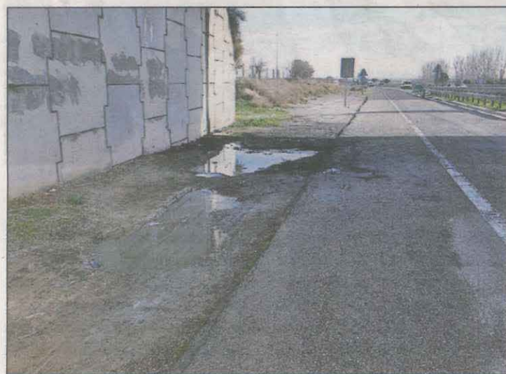
Imatge del punt on va cremar un cotxe a Golmés

Un turisme va quedar ahir totalment calcinat en incendiar-se quan circulava pel quilòmetre 489 de l'A-2, al terme municipal de Golmés. Emergències va ser alertada a les 10.54 hores i es va desplaçar una dotació dels Bombers. A més, a les 9.28 hores va cremar la part davantera d'un turisme a l'L-310, als Plans de Sió. En cap cas va haver-hi ferits.