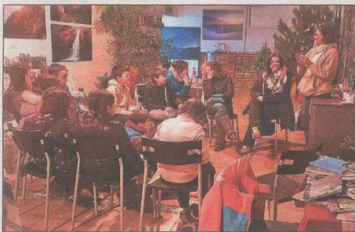
Van participar una desena de joves

La Societat Coral La Lira, fundada el 1877, va comprar l'edifici el 1922 fent una gran tasca de dinamització cultural. Ja aleshores, gràcies a la col·laboració ciutadana, es va aconseguir adquirir la Lira Vella a través d'emprèstits de vint-i-cinc pessetes de diversos socis. Va ser el centre neuràlgic de la vida cultural de Tremp i rodalies fins que va arribar la Guerra Civil i va ser espoliat. Actualment, està en un estat d'abandonament on les restes de La Lira Vella havien quedat ocultes.