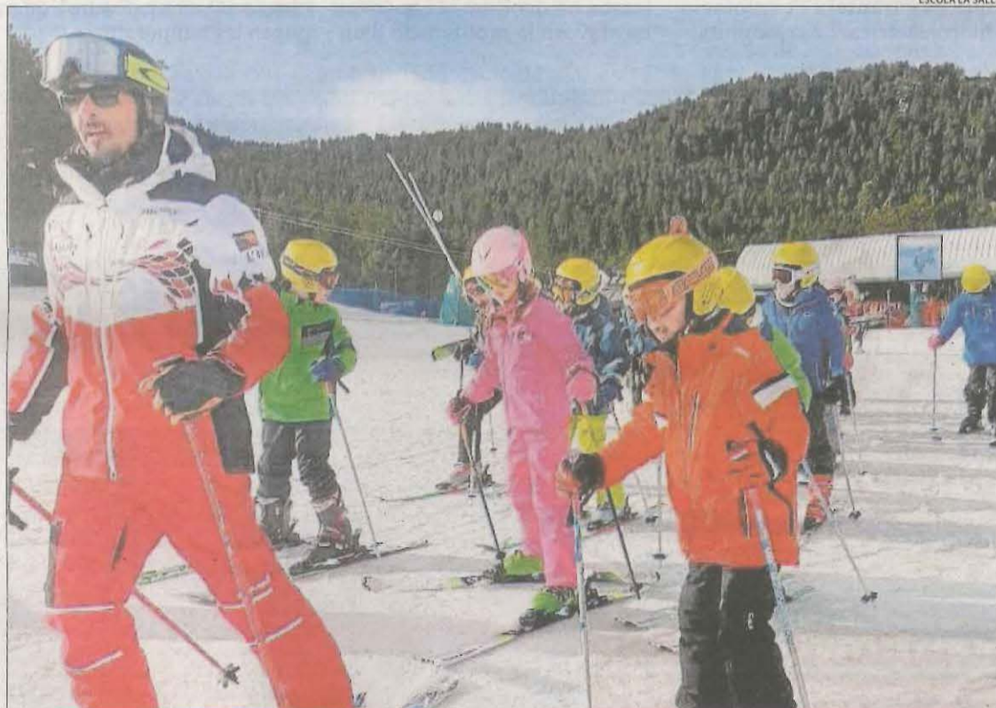
Alumnes de La Salle de la Seu ahir a l'estació de Masella.

Fonts de Tot Nòrdic, que agrupa tots els complexos d'esquí de fons del Pirineu, van apuntar ahir que treballen per traslladar les activitats d'esquí nòrdic dels grups escolars a l'estació andorrana de La Rabassa, que disposa de neu a les instal·lacions, per no haver d'anul·lar les activitats de l'esquí escolar previstes al Pirineu lleidatà. Les estacions esperen noves preci-