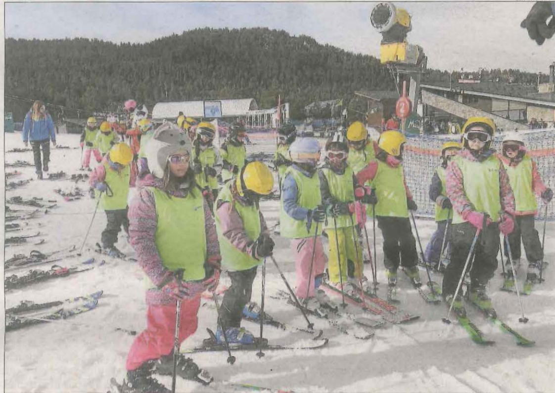
Els primers alumnes del CEIP Pau Claris de la Seu que van estrenar la temporada d'esquí escolar.

Les estacions d'esquí nòrdic van lamentar ahir l'escassa activitat durant les festes de Na-