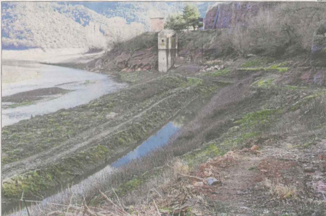
El fons sec de la cua de l'embassament d'Oliana, al Segre, on ha crescut vegetació.

La situació és una mica millor a les conques de la Noguera Pallaresa, que es manté en