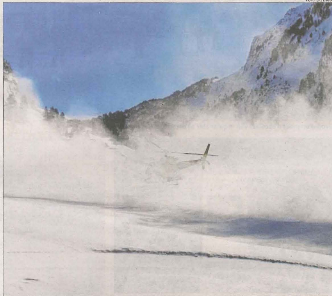
Imatge de l'helicòpter dels Bompiers a la zona de l'accident ahir a Aran.