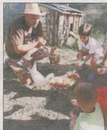
Eco Horts El Verger.