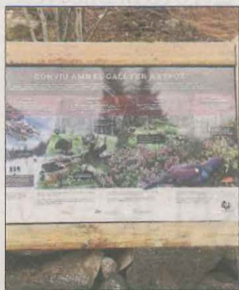
Conservació del gall fer.

Entre aquestes iniciatives, públiques i privades, figuren Ponent Actiu, Via Verda dels Canals d'Urgell, Tresors del Cadí, Octagon Trade (edificis turístics modulars de fusta) o bé Salvatge (turisme de naturalesa a Bovera), Torres & Earth, Birding Lleida Ex-