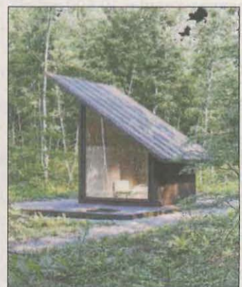
Projecte d'Octagon Trade.

pedicions o Gràtitud Pallars, de recuperació i difusió del patrimoni pirinenc.