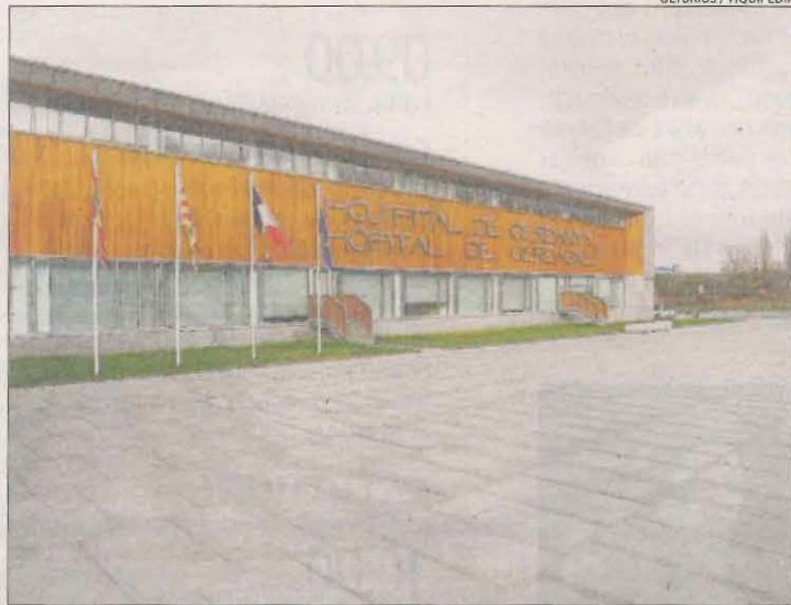
Imatge d'arxiu de l'Hospital de la Cerdanya.