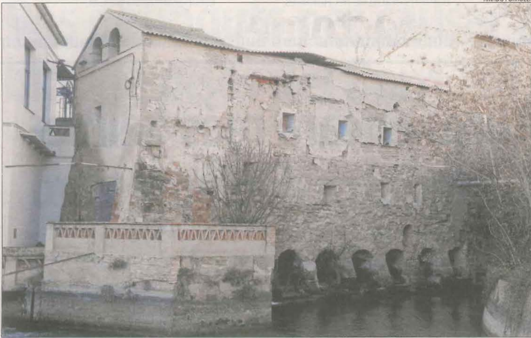
Estat actual del molí fariner d'Alfarràs, que es convertirà en alberg del Camí de Sant Jaume.