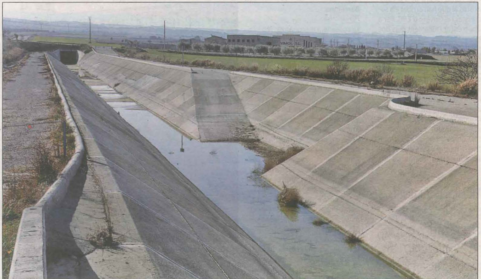
El canal Segarra-Garrigues, al terme municipal de Verdú, rebrà una inversió de 16,4 milions d'euros, la més important a les Garrigues

Al Segrià, la comarca on el pressupost preveu més inversions, destaquen els 5,5 MEUR per a l'aeroport de Lleida-Alguaire i els 7,5 milions en inversions al