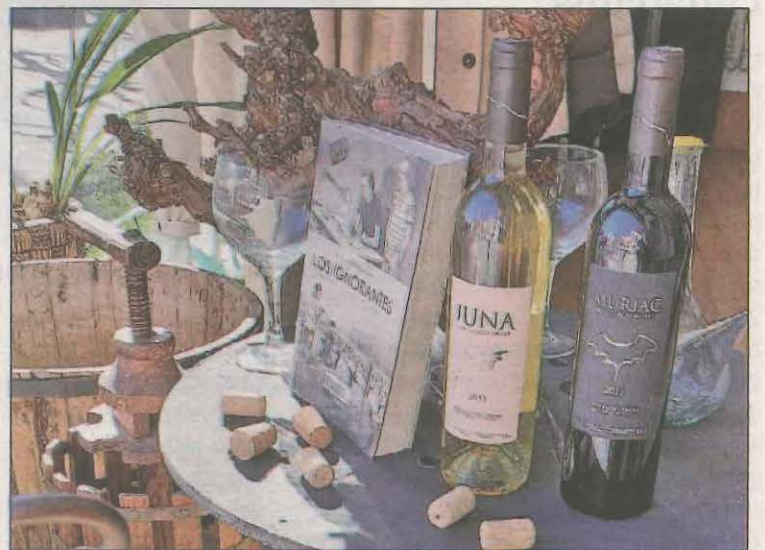
Una de les composicions que es podran veure

Pel que fa al concurs, hi ha un premi per a l'establiment més votat pel públic (a través d'un formulari virtual: https://forms.gle/NcSbJBgWGiUeUovMA ), consistent en una falca publicitària a Ràdio Tremp i un baner a Pallars Digital. A partir de les visites a aquesta "exposició" també s'ha convocat un sorteig adreçat al públic.