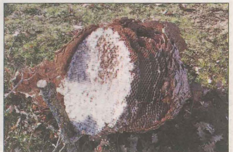
Imatge del niu que s'ha desmantellat

Aquesta espècie s'està estenent per tot Catalunya, i la Seu d'Urgell no és una excepció. Per això és important tenir identificada la seva presència al nostre municipi. Per aquest motiu es demana a la ciutadania que en cas de detectar un vesper de vespa asiàtica, sobretot a finals d'hivern fins a la tardor, que ho comuniqui a l'Ajuntament de la Seu per tal que se'n pugui valorar quina ha de ser l'actuació. Cal dir que les quatre