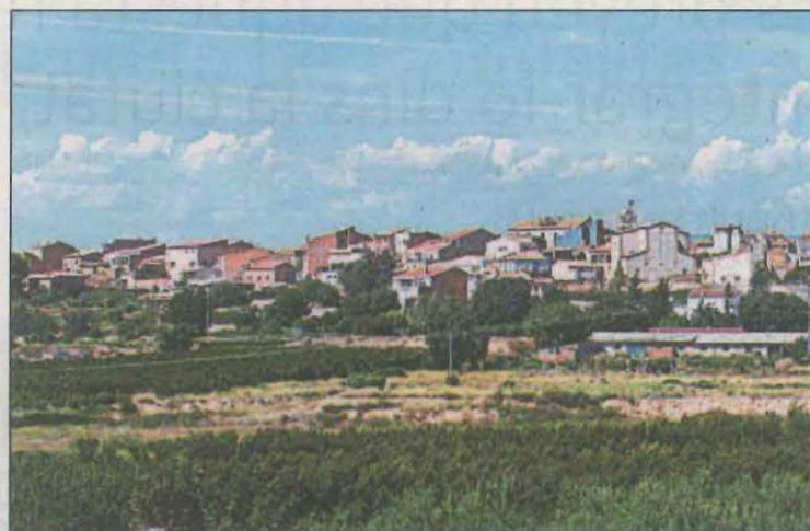
Imatge de la població de La Portella

La ronda nord tindrà 500 metres de llargada, entre el camí de Roca Figuera i el camí del Cementiri. A més d'acollir el trànsit de camions, connectarà el camí del cementiri amb la cruïlla entre els camins que connecten Almenar i Alguaire. El nou traçat viari tindrà una amplada de 10 metres, amb dos carrils per sentit per a vehicles, altres dos per a bicicletes i un camí verd per a vianants, especifica la nota difosa ahir per la Conselleria de Territori.