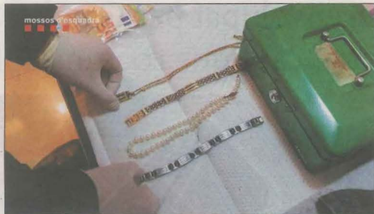
Imatge de joies recuperades per la policia catalana

Els Mossos han desarticulat un grup criminal molt actiu dedicat als robatoris amb força a domicilis i han detingut quatre persones. Es tracta de tres homes d'entre 30 i 32 anys, que no tenien residència a Catalunya, i una dona de 25 anys. A dos dels arrestats se'ls atribueixen també delictes contra la salut pública per cultivar marihuana. La principal hipòtesi sobre els detinguts és que són persones sense domicili estable a Catalunya, que treballen per màfies que trafiquen amb marihuana. Els arrestats feien de jardiniers en plantacions de marihuana interiors a la demarcació de Ponent. Un cop desmantellades les plantacions pels Mossos al de-