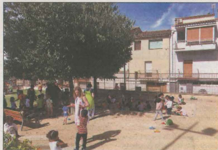
El pati d'aquest centre escolar

A més a més, dels castanyers, al pati de l'escola que instal·larà tres fonts d'aigua.