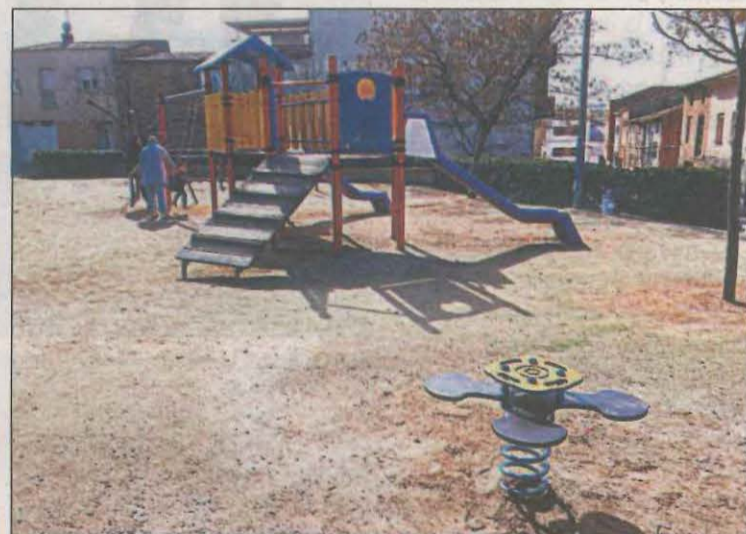
Un dels parcs infantils del poble

nés, "hem fet aquestes millores des del consistori per tal que les àrees municipals de jocs recreatius per als més menuts estiguin en perfectes condicions, tant de seguretat com de salubritat, com és el cas dels sorrals, que són d'arena rentada de riu perquè sigui una superfície més tova quan els infants cauen a terra mentre juguen".