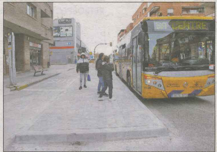
El autobús debe parar en medio de la calle