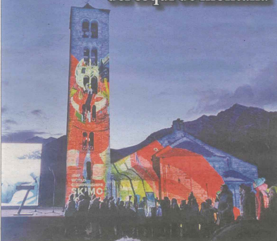
El espectáculo inaugural del Mundial, junto a la iglesia de Sant Climent de Taüll | PÁG. 24