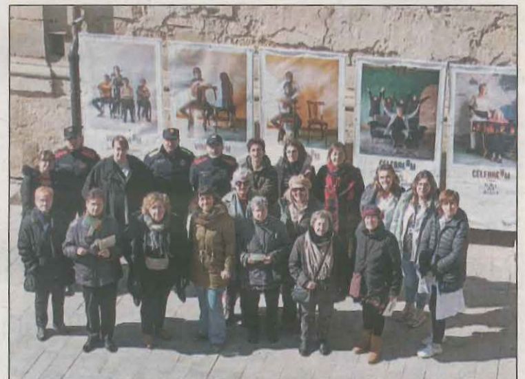
Presentació del programa d'actes a Tàrrrega