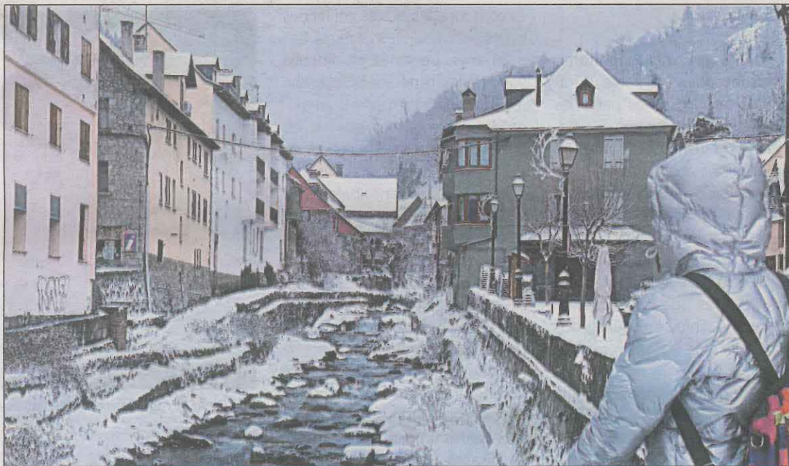
Una turista observant el riu Nere, totalment nevad als marges, al seu pas per Vielha

Segons informà el Servei Meteorològic de Catalunya (SMC) a través del seu compte de Twitter, la matinada d'ahir dilluns va ser la més freda de l'hivern a les àrees de muntanya. La temperatura mínima va ser de -19,6 graus