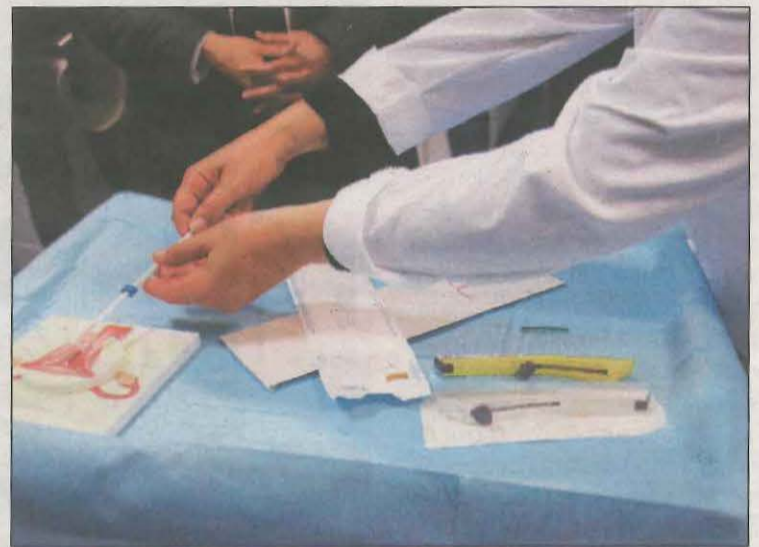
Els diferents mètodes anticonceptius de llarga durada

El primer dura aproximament uns cinc anys, i la durabilitat del segon es redueix a tres. Pel que fa als costos, oscil·len entre els