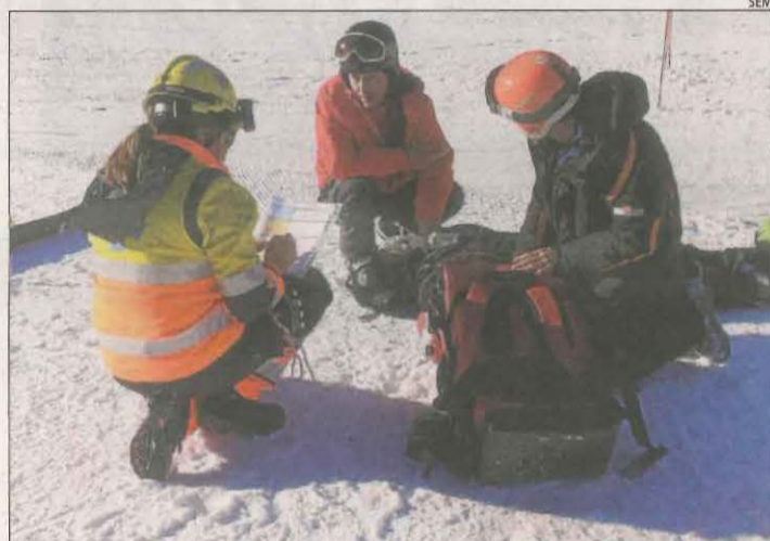
Efectius d'emergència, durant el simulacre a Port Ainé.