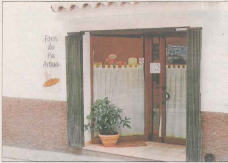
Imatge de Lo Forn d'Algerri, que ahir va tancar portes.

L'últim cas és el forn d'Algerri, que ahir va servir les últimes barres de pa després de més de 50 anys de servei. Aquest tancament se suma als dels últims