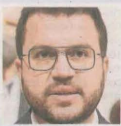
President de la Generalitat

«Van buscar parilitzar el 9N i frenar l'opinió de la ciutadania catalana amb joc brut, com sempre»