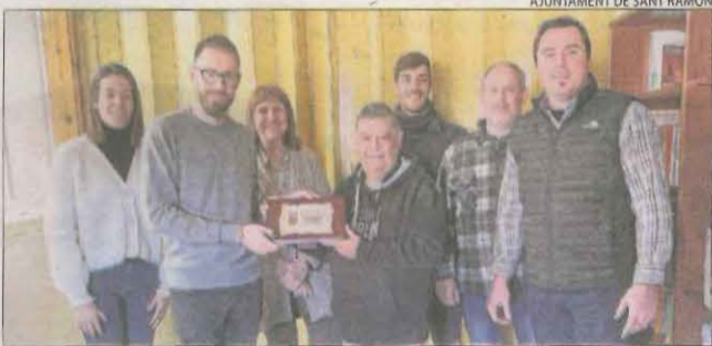
AJUNTAMENT DE SANT RAMON