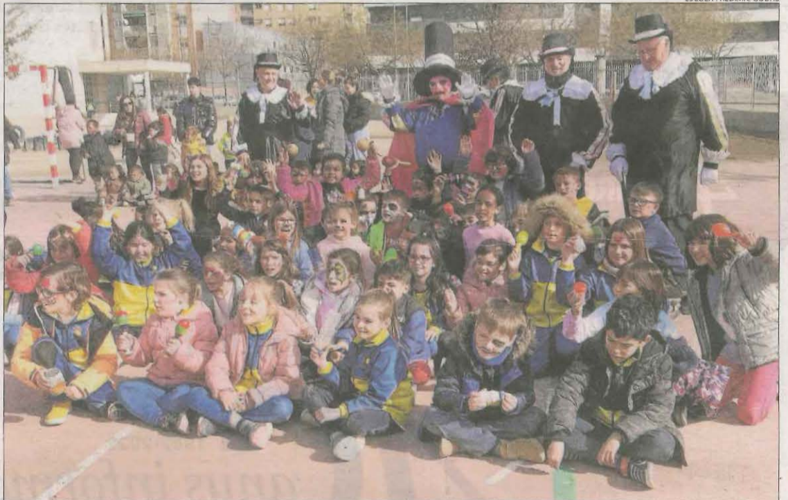
ESCOLA FREDERIC GODÀS

Correus de Solsona van participar ahir en la xocolatada solidària que organitza cada any l'hospital Sant Joan de Déu de Barcelona amb l'objectiu de recaptar fons que aniran destinats a la investigació del càncer infantil. En aquesta proposta van participar centenars d'escoles, instituts, empreses i entitats de tot Catalunya.