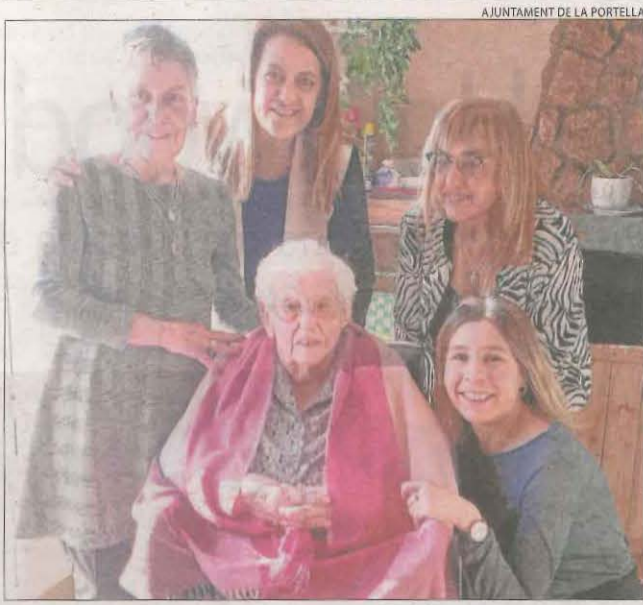
AJUNTAMENT DE LA PORTELLA