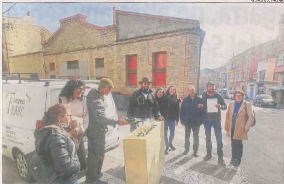
ATENEU DEL PALLARS