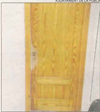
Una porta rebentada.