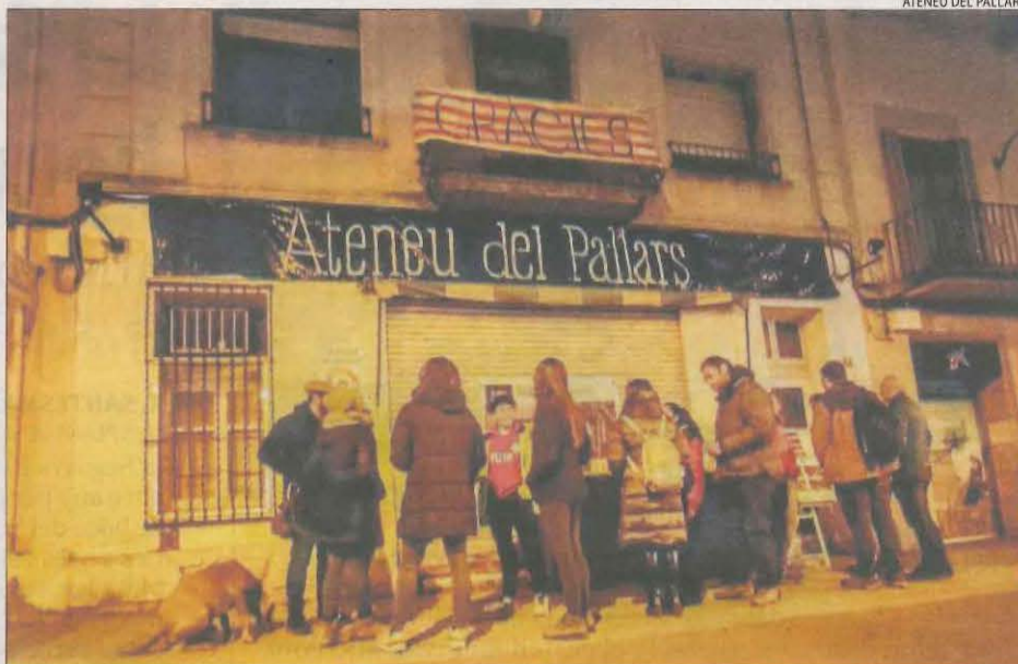
ATENEU DEL PALLARS