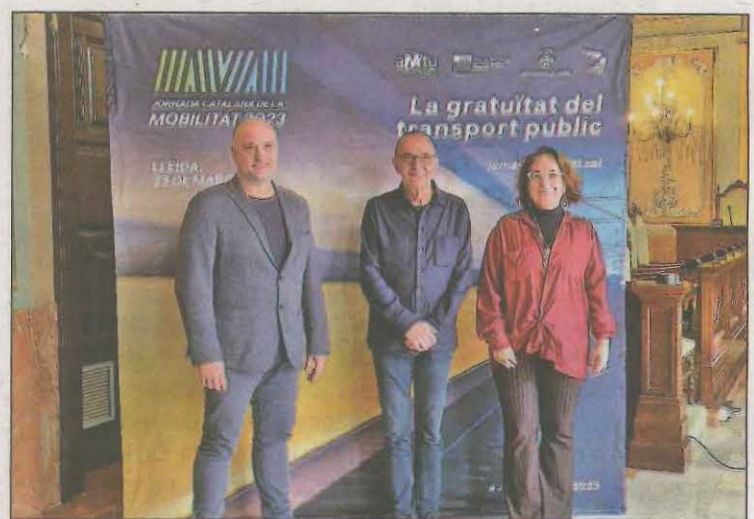
El Saló de plens va acollir la presentació de la jornada

ció de Municipis per la Mobilitat i el Transport Urbà (AMTU) en un moment en què "estem impulsant el canvi que estem fent de Lleida, cap a un model de mobilitat transformador i sostenible, basat, entre altres, en vehicles de combustió interna o en la promoció del transport públic." A més va dir que es té en perspectiva una nova terminal d'autobusos.