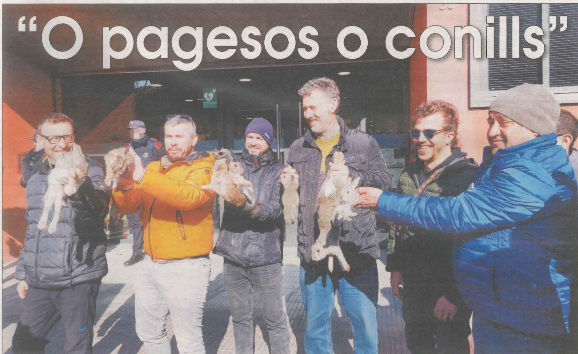
Un grupo de agricultores con algunos conejos ante la sede de Acció Climàtica, donde hubo incidentes cuando los manifestantes lanzaron los animales dentro del edificio

► TRACTORADA HISTÓRICA. Un millar de tractores recorren la ciudad de Lleida contra la plaga de conejos