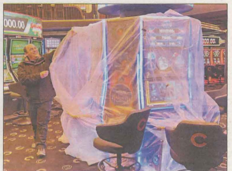
Un treballador del Casino d'Andorra, treient les proteccions

El director general d'Unnic, Ivan Armengod, assegura que porten molt temps treballant per fer realitat aquest projecte, ideat amb un concepte de centre d'oci i entreteniment global amb quatre restaurants, zones de joc d'atzar, espais de negocis i espectacles, entre d'altres. És per això que creu que hi poden haver "sorpreses positives", tenint en compte les expectatives que s'estan generant. Armengod explica que a molts dels espais del centre es podrà entrar sense identificació, com ara les sales d'espectacles, cocteleria i restauració, però serà necessària per a la zona de joc.