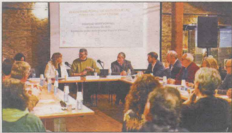
Reunió de la consellera amb la Xarxa de Lleida i Aran