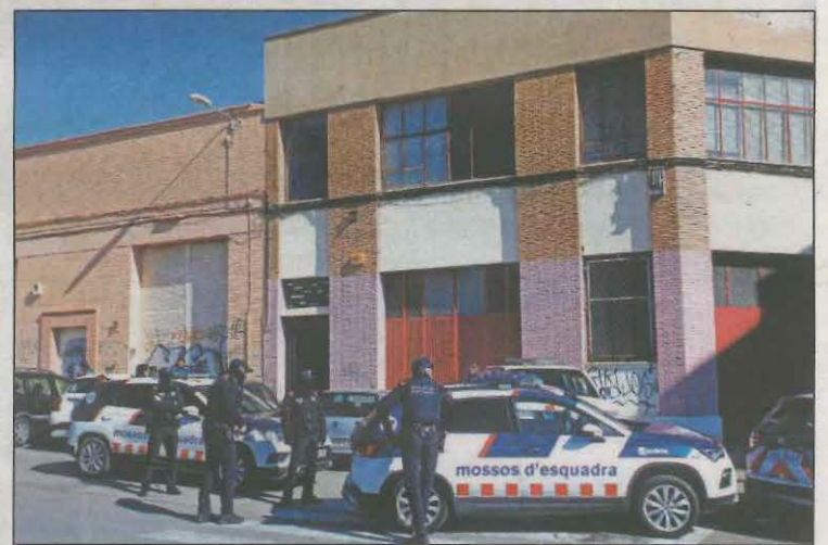
Imatge d'una de les naus on es van fer registres

trolant aquests llocs i, dimarts a la nit, un agent fora de servei va detectar a Torregrossa un vehicle aturat davant una de les naus i dos homes que semblava volien forçar l'entrada. En veure's sorpresos van marxar amb un vehicle, sent aturats a l'N-240, a Juncada. A més, portaven passaports d'altres persones i les claus d'una furgoneta aparcada on la nau.