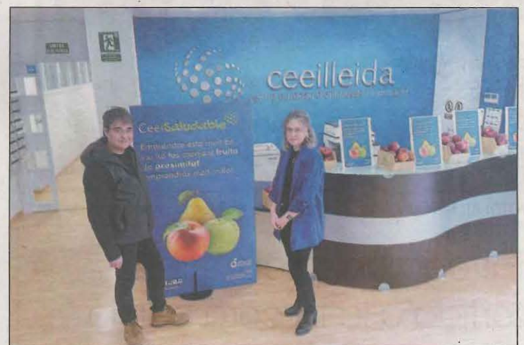
Es col·locaran bols amb fruita variada i de proximitat

Un dels objectius de la iniciativa és el de fomentar la salut i els bons hàbits en el lloc de treball, i posar a disposició totes les eines i productes necessaris per a oferir un entorn de treball més saludable, tal com recomana la Declaració de Luxemburg.