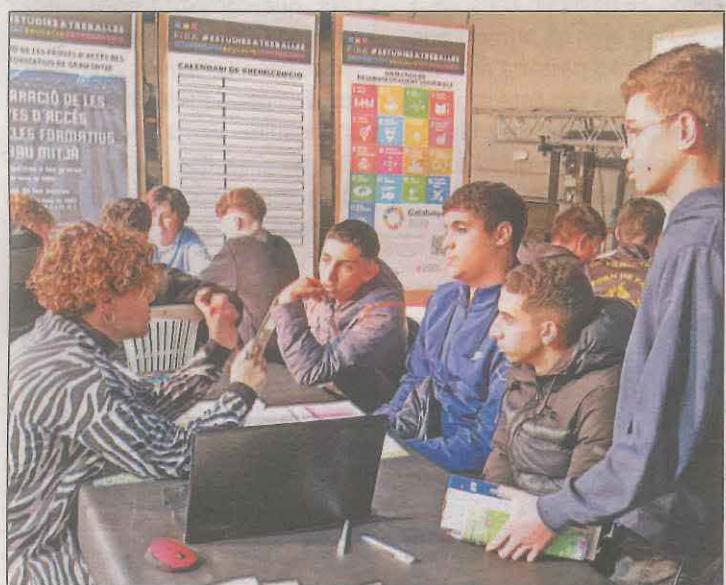
Joves s'informen de les ofertes en un dels estands

Els treballs consistiran en la regularització i reparació de l'esplanada, la millora del paviment del camí, l'adequació dels elements de drenatge, la neteja i perfilat de cunetes, i la millora de la senyalització vertical i horitzontal. En paral·lel, amb la voluntat de contribuir a la millora de les connexions a les zones de muntanya, el Departament de Territori està analitzant conjuntament amb l'Ajuntament de Sant Esteve de la Sarga l'estat de la xarxa de camins. Altres ajuts han permès l'arranjament dels camins de Sant Esteve de la Sarga a Alsamora i de Sant Esteve de la Sarga a Castissent.