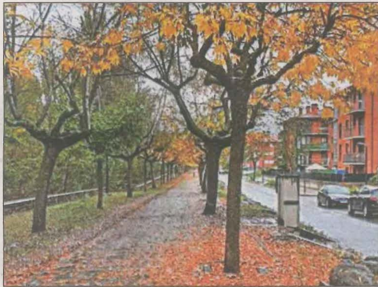
Passeig Josep Borrell i Fontelles, a la Pobla de Segur

Ara, les persones majors de 16 anys, nascudes o domiciliades a la Pobla de Segur, tindran l'oportunitat de decidir aquest diumenge 12 de març si volen mantenir