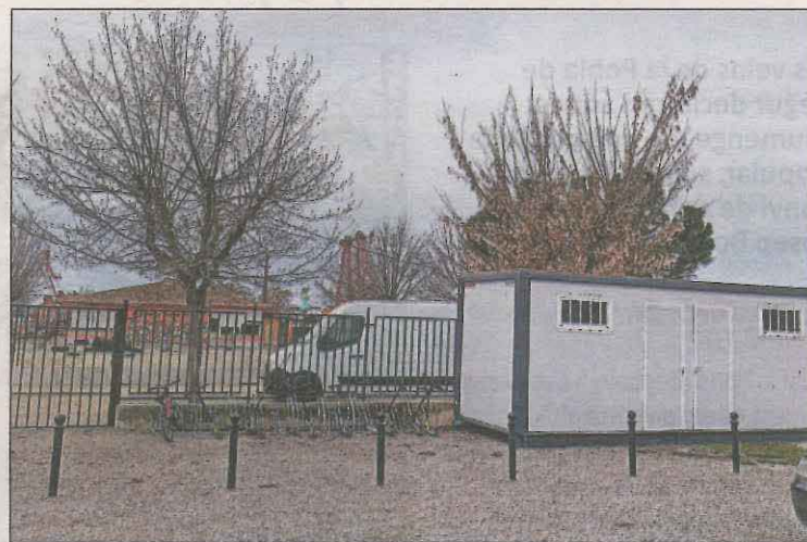
Imatge dels banys instal·lats per part de l'ajuntament

En concret, es tractaven d'unes obres per allargar un carrer que els faran perdre uns 300 metres quadrats de pati, el que suposa un 25 per cent de l'espai amb què compten. Això, va provocar les queixes de l'equip directiu, els docents i les famílies, que es van manifestar per protestar contra el projecte. "Gràcies a aquesta mobilització, es va fer una reunió amb l'ajuntament en què se'ns va prometre accelerar l'aprovació del POUM per poder donar a l'escola Mestre Ignasi Pe-