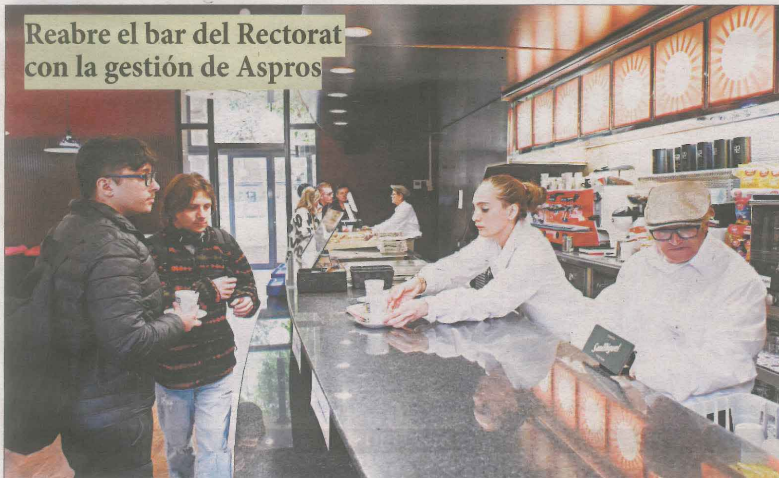
El proyecto de la fundación ofrece desayunos, menús y servicio de cafetería para la comunidad universitaria LOCAL | PÁG. 9